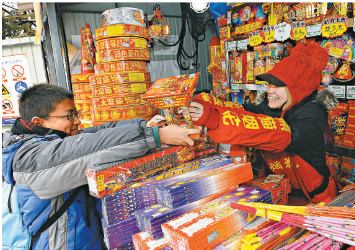
▲北京20日全城開賣龍年煙花爆竹，圖為一名小男孩在石景山煙花銷售點購買煙花