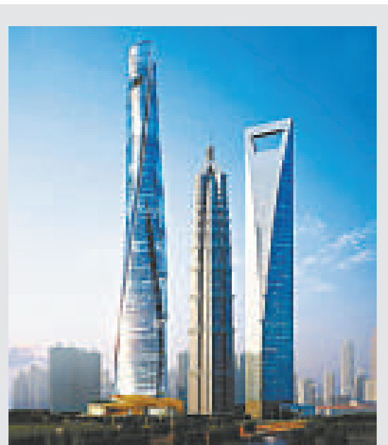
▲上海第一高樓（左）正以七天一層的速度節節升高