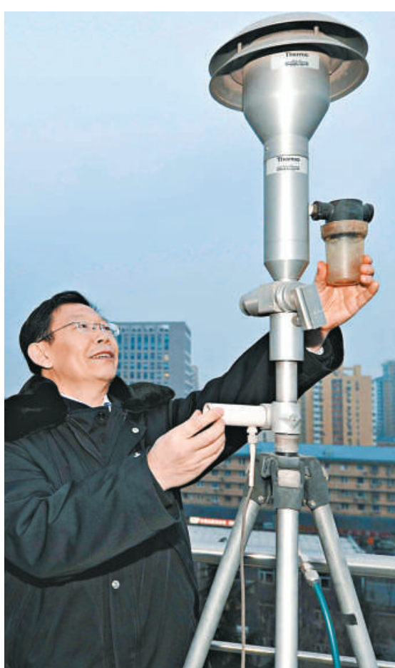
▲北京環境保護監測中心工作人員在調整PM2.5 監測設備

【本報訊】在社會輿論的「千呼萬喚」下，北京的PM2.5監測數據21日終於向社會公布。