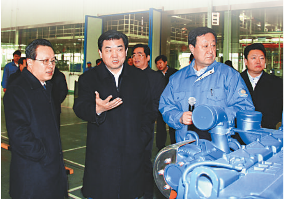
▲濰坊市委書記許立全（前排左二）在濰坊高新技術開發區調研