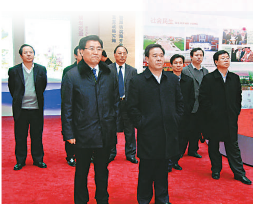
▲濰坊市委副書記、代市長劉曙光（前排右一）在濱海經濟技術開發區調研

龍騰喜浪迎新紀，兔樂豐登送舊年。在龍年新春來臨之際，我們代表900萬濰坊人民，向一直關心和支... 表示誠摯的謝意和美好的祝願！