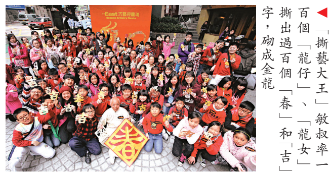
「撕藝大王」敏叔率一百個「龍仔」、「龍女」撕出過百個「春」和「吉」字，砌成金龍