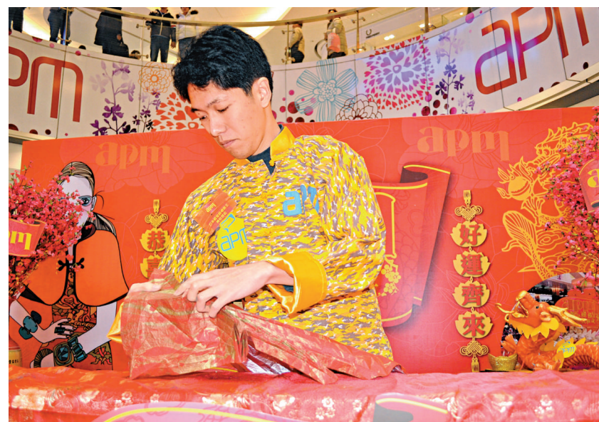
神谷示範生肖龍的摺法

不過，相比那條需要一千多個步驟完成的「龍神」，這隻橙色虎就「小巫見大巫」了。「龍神」貌不驚人，在紫色猴子、褐色牛和趴在荷花