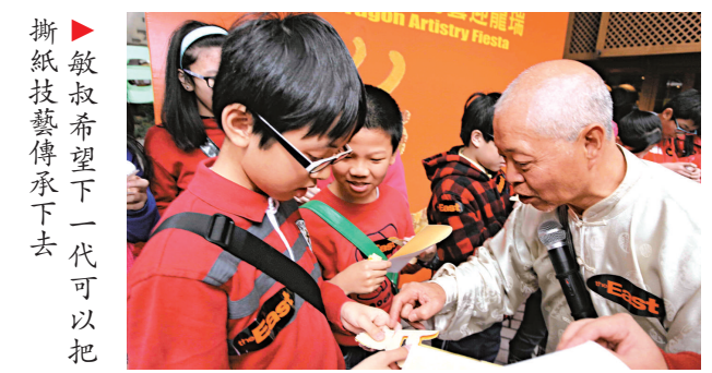
敏叔希望下一代可以把撕紙技藝傳承下去

目前這件撕藝作品金龍正作展覽，至二月六日結束。敏叔亦將同場於明天(二十七日)中午十二時至下午二時，及一月三十日下午二時至四時向公眾傳授及展示撕紙藝術，親手撕揮春。今次展覽地點：灣仔皇后大道東 183 號 The East 合和中心地下露天廣場。查詢電話：二八六三二五二六。