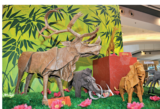
神谷此次展出「動物園」系列部分作品