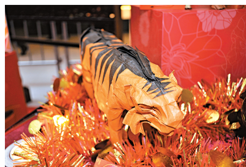
在神谷看來，「十二生肖」系列中，橙色黑斑紋的老虎最難摺