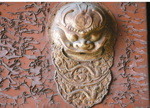
北京紫禁城午門的「椒圖」鋪首