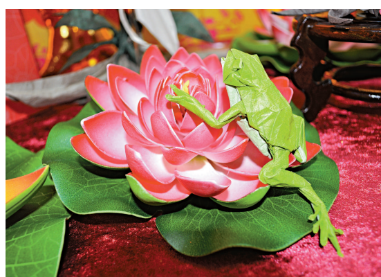
伏在荷花上的綠蛙