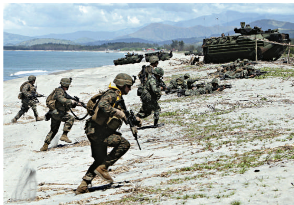
◀2011年10月，美國和菲律賓的海軍陸戰隊在菲律賓呂宋島三描禮士省進行搶灘演習

此外，美國國務院27日宣布，此次美菲第二次戰略對話取得了成果，其中包括美國向菲律賓海軍轉讓「漢密爾頓」號武裝快艇，以增強菲律賓海上預警能力。向菲律賓轉讓第二艘武裝快艇正在美國國會