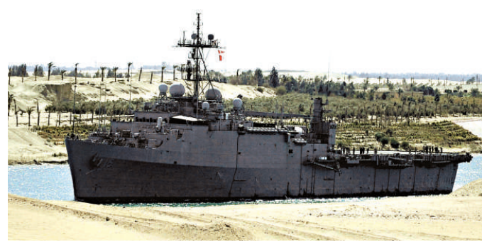
▲2011年3月，美國兩棲攻擊艦USS Ponce通過蘇伊士運河運送物資。該船將改裝成美軍在中東進行特種部隊突擊行動的「母船」

五角大樓在未來十年內面臨至少4870億美元的開支削減，特種作戰部隊是奧巴馬政府使軍隊精簡、更敏捷戰略的重要組成部分。去年5月，特種部隊「海豹」突擊隊在巴基斯坦發動打擊，擊斃「基地」組織領導人本·拉登。本周三，「海豹」突擊隊從