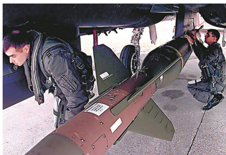
▲美軍的一枚GBU-28「巨型鑽地彈」（重2268公斤）