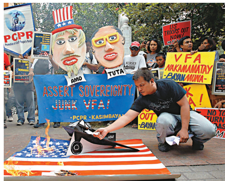
▲菲律賓示威者28日在馬尼拉美國使館前示威，抗議菲律賓允許美軍在菲擴大駐軍

【本報訊】據世界新聞網28日消息：菲律賓政府27日表示，2012年度菲美「肩並肩」雙邊聯合軍演將在「沒有爭議的」菲律賓領土內舉行。菲國此說明被視為是不想讓中國發火。