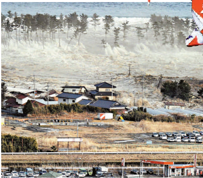
▲2011年日本宮城縣海嘯，破壞力驚人