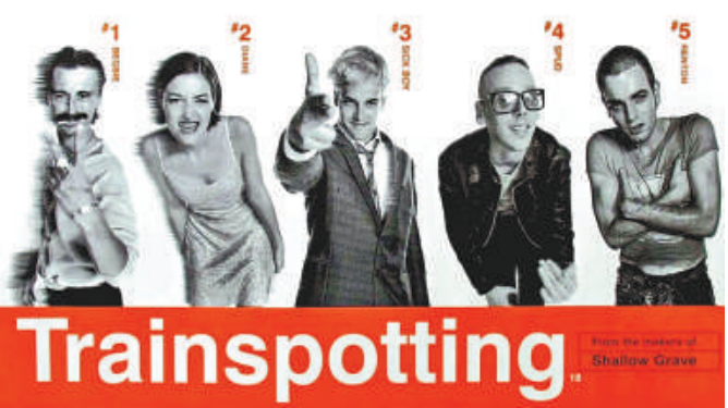
▲電影海報《迷幻列車》