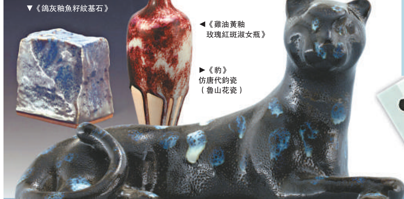
▼《鴿灰釉魚籽紋基石》

本次展覽至二月十八日結束，展覽時間每日下午一時至晚上十時。地點：APM Kubrick，九龍觀塘道四百一十八號創紀之城五期，APM六樓L6-1A舖查詢：cheuk_man@live.hk