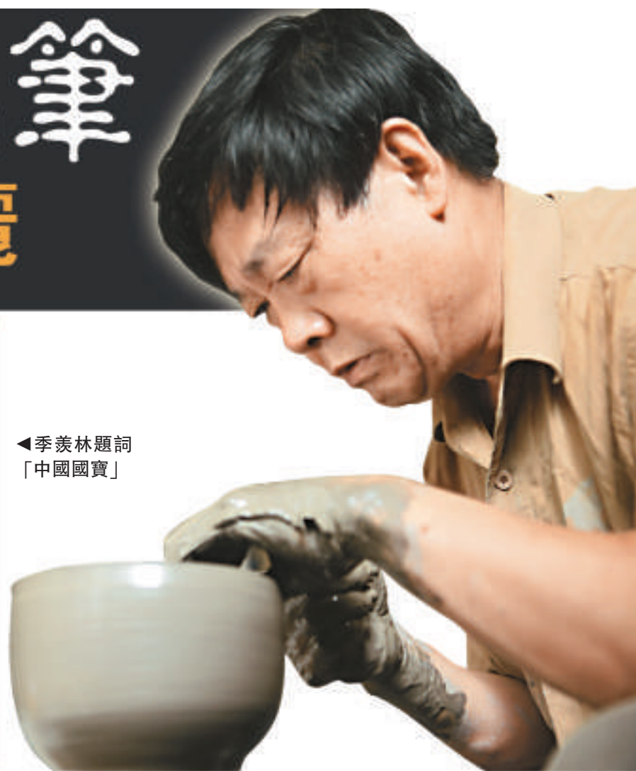
◀季羨林題詞「中國國寶」