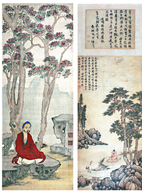
▲清代畫家羅聘的《菩薩摩訶》 ▲明代畫家沈周的《祝洪像》