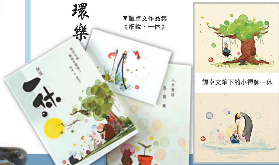
▼譚卓文作品集《細說·一休》