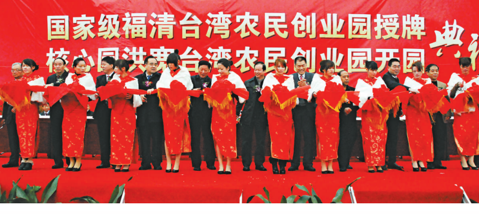
▲國家級福清台灣農民創業園授牌和核心園洪寬台灣農民創業園開園典禮日前在洪寬村同時舉行