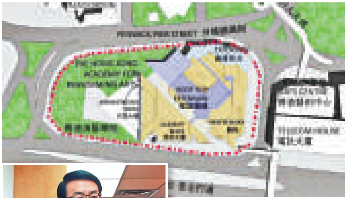
▲演藝擬在灣仔劇院大樓原址加建一層，並在校園東北角興建九層教學樓

演藝學院硬件升級，但卻面臨「高速前行，方向不明，無人駕駛」的挑戰。教資會在一〇年《展望香港高等教育體系》報告提出，當前由民政事務規管的演藝學院可頒學位又受公帑資助，理應歸入教資會系統，並由教育局規管。但教資會由始至終未同演藝