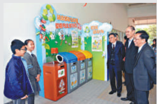
▲「減廢回收在校園 塑膠再生變資源」活動昨日啓動

書商代表指出，已向津小議會清晰反映業界的立場，強調當時提出分拆教材的情況是為了提醒當局成立撥款機制，並無「追數」之意，稍後會書面解釋事件。