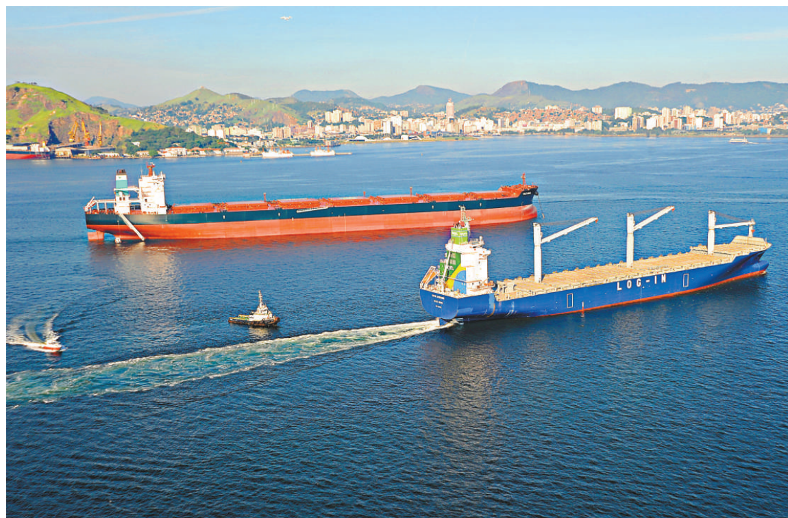
▲巴西政府將就Valemax型貨船不能進入中國港口問題，與中國政府進行外交談判。圖後方是「淡水河谷巴西」號貨輪

淡水河谷公司「Fabrica」，是世界上最大的乾散貨浮式儲存船隻，已於上週到達蘇碧灣。這艘擁有28萬載重噸的船隻將作為平台，用以中轉來自「Valemax」船的鐵礦石至小型船隻，再轉運至亞洲其他港口。「Valemax」船將於2月12日到達蘇碧灣港。蘇碧灣港務局預期該船將停留一天。但有分析師