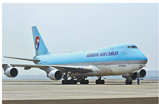
▲大韓航空成為全球首家擁有波音747-8型和777型貨機的航空公司