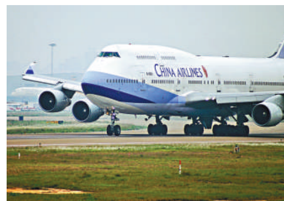
▲華航封存2架貨機於美國沙漠

目前華航有20架747-400型全貨機，長榮的全貨機包括9架747-400型及8架MD-11型，另有4架