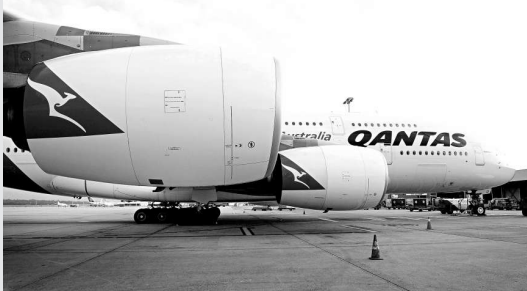
▲澳航 8 日取消了空巴 A380 客機航班服務，因發現機翼有多處「輕微裂縫」，圖為澳航 A380 在墨爾本機場停機坪上

上月由於部分空巴 A380 機翼裡面的連接件出現裂紋，歐洲航空安全局針對空巴 A380 發出適航指令，要求部分 A380 進行檢查。空巴公司 1 月 25 日證實，設計和製造缺陷導致一些 A380 型客機機翼部件出現裂紋。不過空巴聲稱，裂紋易修復，無礙飛行安全，打算更換機翼內部支架的合金材料。