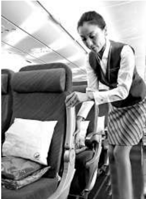
▲空巴擬加寬單通道機在通道座椅的寬度，以迎合需求

波音和空巴一直在窄體飛機的銷售市場中明爭暗鬥，都希望找到新的方案吸引乘客，獲得更大的市場份額。而加寬靠走道座椅的計劃將成為 A320 飛機的新賣點。