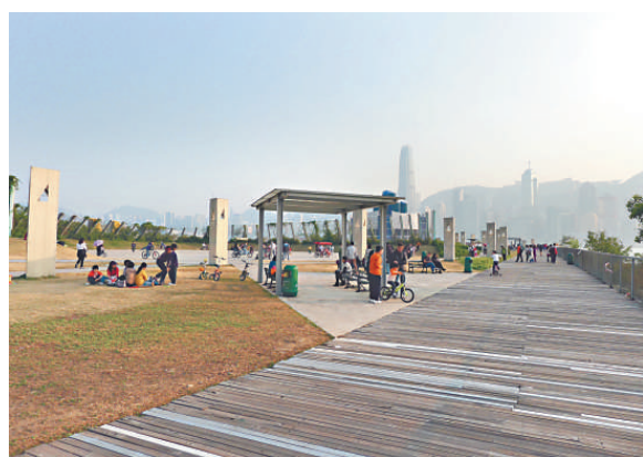
▲現時的西九龍海濱長廊，日後將會是香港的文化藝術集中地

生土長的人才，例如接受香港政府最大資助的演藝組織——香港管弦樂團，其僱用的90名全職演奏家，當中只有10位是來自香港；至於香港中樂團內85名成員中，只有22名是香港本地培育的演奏家；香港芭蕾舞團42名舞蹈員中，更只有4名是來自香港本土的成員，23名舞蹈員來自中國內地。反觀鄰近地方，例如台灣及韓國，它們的演藝團體的成員，本地的人數比例都是佔超過7成。