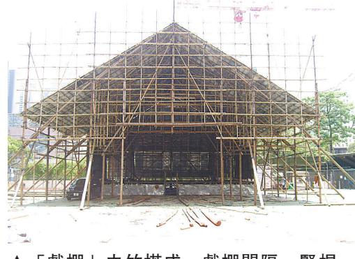
▲「戲棚」由竹搭成，戲棚間隔、豎樑、框架至屋脊，井然有序，給人一種凌空的空間感。

香港戲棚的建立，多見於香港風俗和傳統節日，例如太平清醮和盂蘭勝會。香港戲棚的設計遠看像巨型的金鐘，人稱「大金鐘」，有中國傳統建築的平衡和對稱之美。戲棚間隔、豎樑、框架至屋脊，井然有序，令人有一種凌空的空間感。棚內的前台後台又是另一空間，每一空間均具自然採光和透風的效果。戲棚的開口、裝飾花牌和舞台樓梯均向中央。戲棚通常設在廟宇附近，目的是方便迎接諸神到戲棚內看大戲（又稱「神功戲」），看戲多為數天，望能酬神娛人、神人共樂。