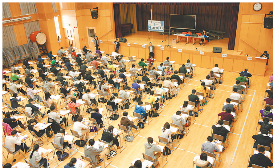
▲公開試前，學生要注意溫習時間和環境外，也要記得多寫下腦海中的答題大綱，順便練習快速書寫

首先是「時間」的安排，因為新高中的課程繁重，不少中學要到3月初才完成教學及考試程序，到第一科公開試不足一個月。以4科必修、2科選修來擬訂溫習時間表，平均每科只有3至4日，但在實際安排上，除考試日前，不應是每日只溫一科，可以是每日2至3科交錯溫習，這可提升溫習的趣味性及積極性。一般而言，中英文兩科的應試能力難以短期催谷，故此學生可以在溫習其他科目時加插中英科的模擬試卷練習。家長應留意，現時中文科已沒有範文考核，所以考生無需要像以前會考般背熟範文的標準答案。在通識方面，重溫6個單元的12主題52條探討題目，再伴以不同模擬試卷的練習，是一個較全面及實際的溫習方法。當然，有中學會考經驗的家長可以具體了解子女各科的評