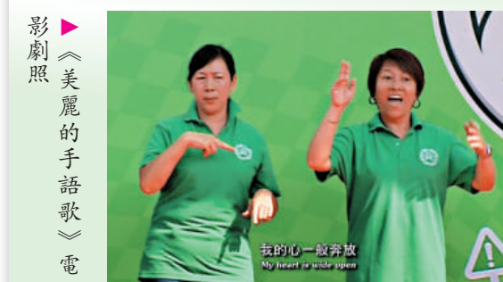
影劇照 ▲《美麗的手語歌》電影

【本報訊】香港城市大學(城大)邵逸夫創意媒體中心聯同香港聾人協會與亞洲民衆戲劇節協會主辦第二屆香港國際聾人電影節，將於本週六(二月十一日)呈獻一場特別節目，放映五部聾人導演製作的電影，以助公眾加深了解聾人的文化。電影將於下午四時至六時在