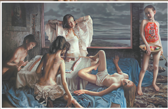
▲《2008北京》(又名《搓麻將的女人》) 2005