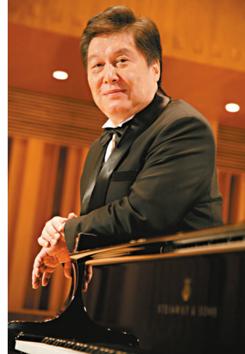
▲殷承宗將於深圳演奏莫扎特作品

在所有的樂曲中，殷承宗表現了對古典音樂的敏銳而又自然的領悟，特別是他彈奏的莫扎特，他能感覺到音樂中張與弛的對比，並恰到好處地強調適當的片段。此次音樂會所演奏的曲目多數為莫扎特作品。其中包括《a小調回旋曲》(作品511)、《d小調幻想曲》(作品397)、《A大調奏鳴曲》(作品331)、還有李斯特《b小調奏鳴曲》等。《華盛頓郵報》曾評價「殷承宗的莫扎特速度保守而嚴謹，表現出正宗古典的風格，他的舒伯特表現了高尚的