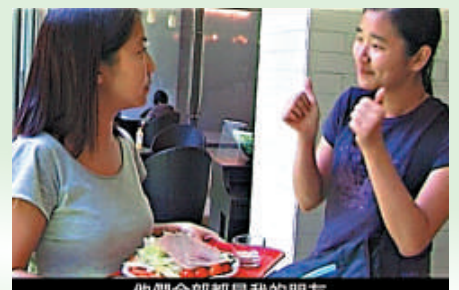
▲《如果我聾了》電影劇照

創意媒體中心三樓的演講廳1(M3017)放映。免費入場。放映的影片來自中國內地、美國、芬蘭、香港等國家和地區，放映的影片包括：《手語時代》、《如果我聾了》、《Gallaudet》、《Shackle》、《美麗的手語歌》。所有影片均配有中英文字幕。放映完畢後，將舉行討論會。有興趣參與的人士，可發電郵予 cmcinfo@cityu.edu.hk 預約留位。查詢節目詳情可電三四二六五五三。