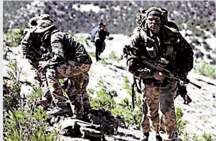
▲英特種兵戰鬥在阿富汗山區

敘利亞的戰略位置重要，敘利亞的背後還有更爲強大的伊朗，對敘利亞進行軍事干預可能遭致更激烈的抵抗。據以色列媒體報道，伊朗革命衛隊已經在敘利亞部署了15000名武裝部隊，以幫助敘利亞總統巴沙爾打擊反對派武裝分子。「一名敘利亞全國委員會的資深成員表示，伊朗革命衛隊下屬精英部隊「聖城旅」的司令官已經抵達敘利亞，協助巴沙爾政府對叛軍的軍事行動。」報道說。如果伊朗真的介入戰事，巴沙爾的籌碼會更多。