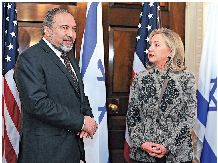
▲7日，以色列外長利伯曼與美國國務卿希拉里交談

油供應國合作，彌補伊朗石油短缺留下的空擋。而就在8日當天，伊朗再次對美國發出警告。伊朗駐俄大使賽賈迪在莫斯科表示，美國攻打伊朗無異於自殺，伊朗有能力對全球範圍內的美國目標進行軍事打擊。