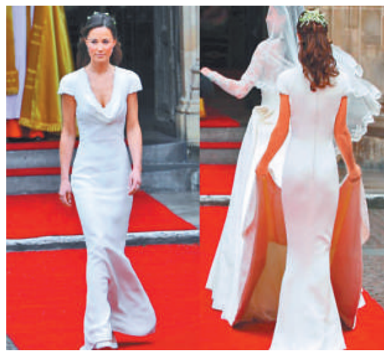
▲皮帕在去年的王室婚禮上風頭一時無兩 互聯網

「全球語言觀察者」機構是利用「敘述追蹤」(NT) 2.0版來做這次分析。NT2.0建基於全球話語，提供實時、準確的資料，使我們知道公眾最新熱議話題是什麼。「敘述追蹤」被用於分析互聯網、博客空間全球75000家印刷和電子媒體，以及新出現的媒體消息來源。