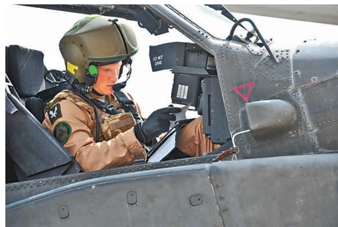
▼哈里王子在「阿帕奇」直升機駕駛艙內