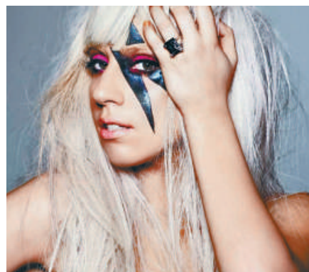
▲Lady Gaga一貫打扮出位，今年卻失寵該榜單 互聯網