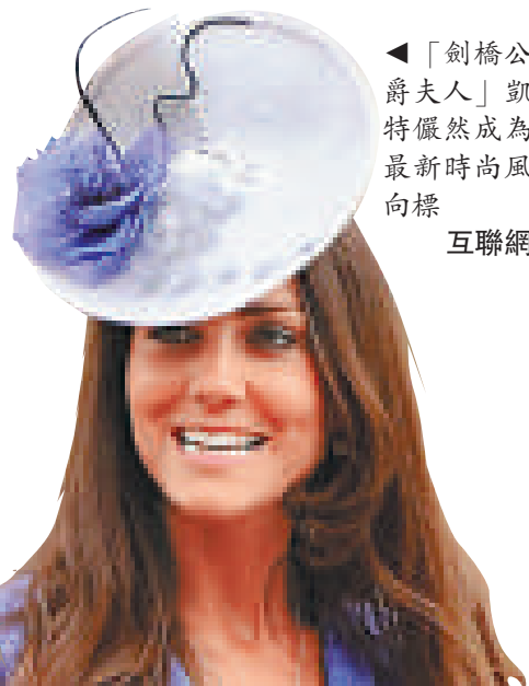
▲「劍橋公爵夫人」凱特儼然成為最新時尚風向標 互聯網