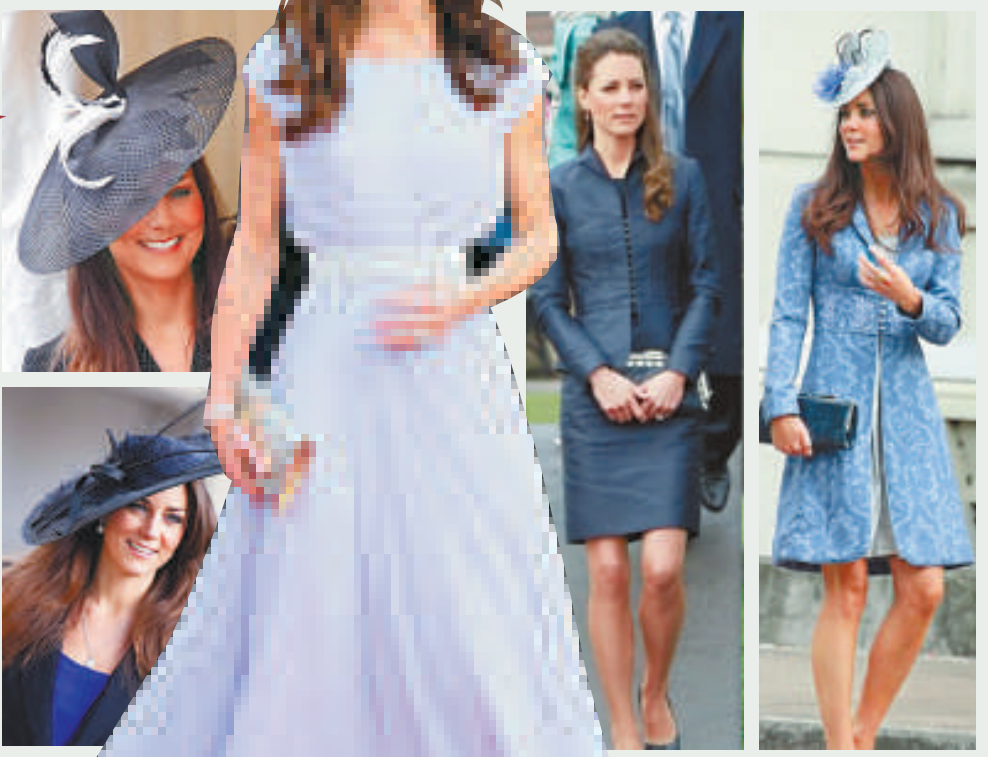
▲凱特穿衣風格備受追捧 互聯網