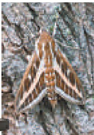
▲飛蛾「小間諜」的翼展開闊如手掌

【本報訊】據英國《每日郵報》8日報導：麻省理工學院的研究員成功在一隻拳頭大的飛蛾上植入一個「神經探頭」，並且能夠通過電子信號「引導」飛蛾。