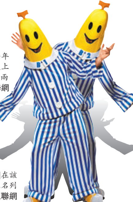
▶「睡衣」在該排行榜上名列前茅 互聯網