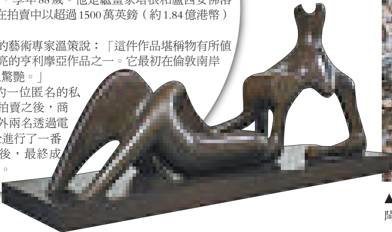
▶亨利摩亞雕塑作品《斜躺的人：節日》 英國《每日郵報》

這件雕塑由紐約一位匿名的私人收藏家拿出來拍賣之後，商人拉赫曼在與另外兩名透過電話競投的人士進行了一番激烈爭奪後，最終成功投得。