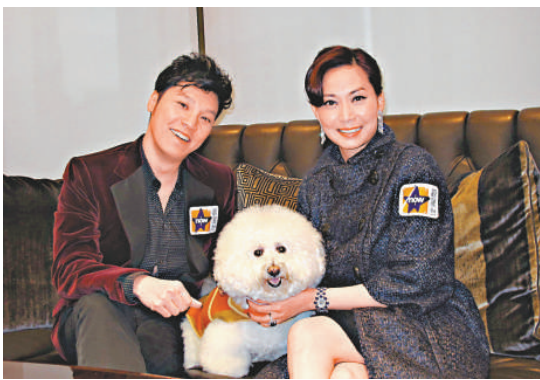
▲鄺美雲（右）接受王賢誌訪問，表示有 Cash 已心足

要才去做，而每次學校開幕，她都會親自出席，甚至朋友興建的學校，她也會代為出席，最高紀錄試過六日內去了內地五個省、七個市共九間學校的活動。雖然每晚返回酒店時只能以杯麵果腹，但 Cally 不以為苦，表示如果身體許可，到八、九十歲也願意繼續做，因她最喜歡見到小朋友，又想傳遞一些信息給他們。