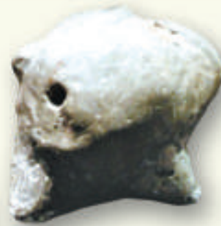
▲兔型陶埙 ▶單體最大的特鑄