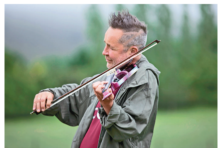
▲奈吉爾·肯尼迪將赴廣州演出

情人節當天，廣州交響樂團也將在星海音樂廳獻上「戀愛百分百」情人節音樂會，特邀國際知名結他演奏家楊雪霏獻藝，包括結他名曲《阿蘭胡埃斯之戀》等九首旋律優美的國外經典愛情名曲與選段，讓情侶們陶醉在優美的音樂中。