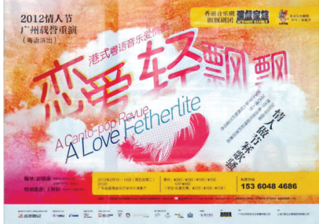
▲情人節當晚，廣州星海音樂廳將奏響系列浪漫愛情音樂