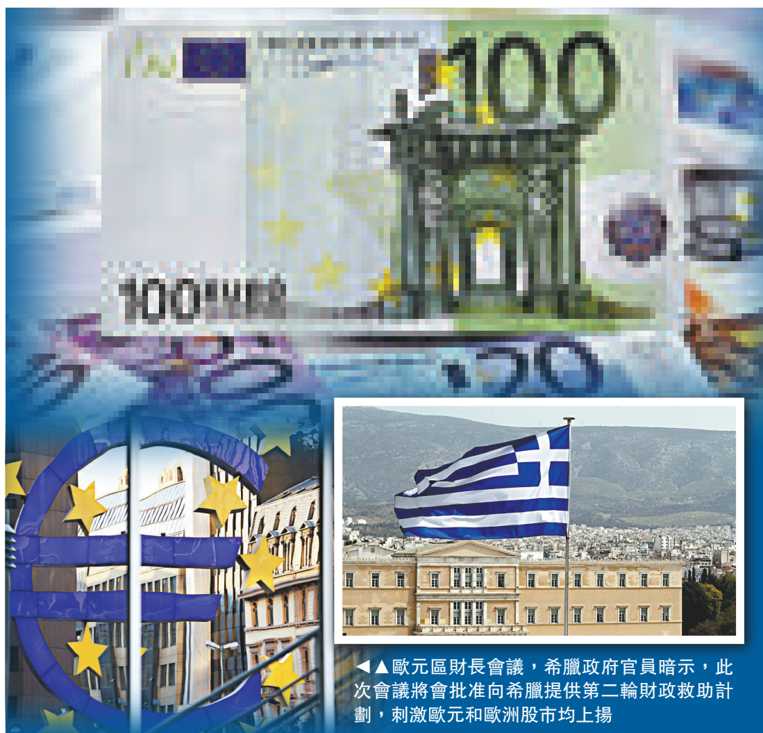
▲歐元區財長會議，希臘政府官員暗示，此次會議將會批准向希臘提供第二輪財政救助計劃，刺激歐元和歐洲股市上揚

據顯示，在過去的3個月間，歐元兌美元已經下跌3.3%，為彭博相關加權指數追蹤的10種貨幣中表現最差的。