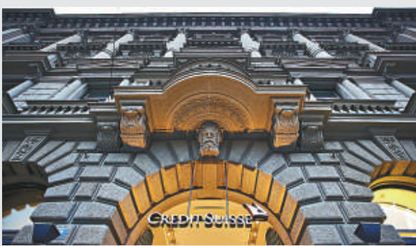
▲瑞士信貸集團公布，第四季度錄得3年以來首個季度虧損

不過，美國製造業創去年6月以來最大升幅，失業率跌至3年低位8.3%，投資者再度追捧高風險資產，摩根士丹利全球指數自去年10月低位反彈二成，進入技術牛市，與此同時美元兌15隻主要貿易貨幣走勢疲弱。2011年大摩指數錄得四次按危機爆發以來最大跌幅。美國 Verizon 通訊、Edison 等防禦類股票今年以來報跌，表現較去年12%升幅失色。今年以來標普500指數升幅為7.3%，2月份以來升2.9%，為1991年以來最佳年初表現。金融、原材料、科技、工業及非必要消費品類股份，全都跑贏大市。