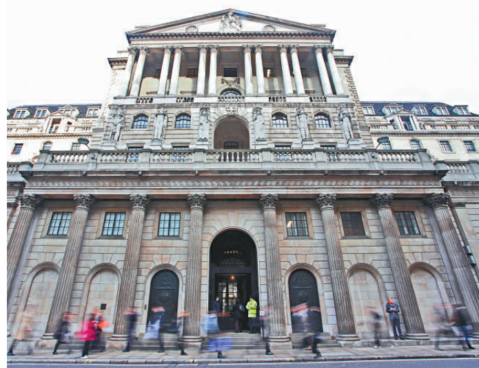
英國央行昨日宣布將加推500億英鎊量化寬鬆

英國央行還指出，儘管最近的商業調查顯示一個更為積極的局面，但是央行對於歐元區國家負債過重以及競爭力擔憂還將繼續。