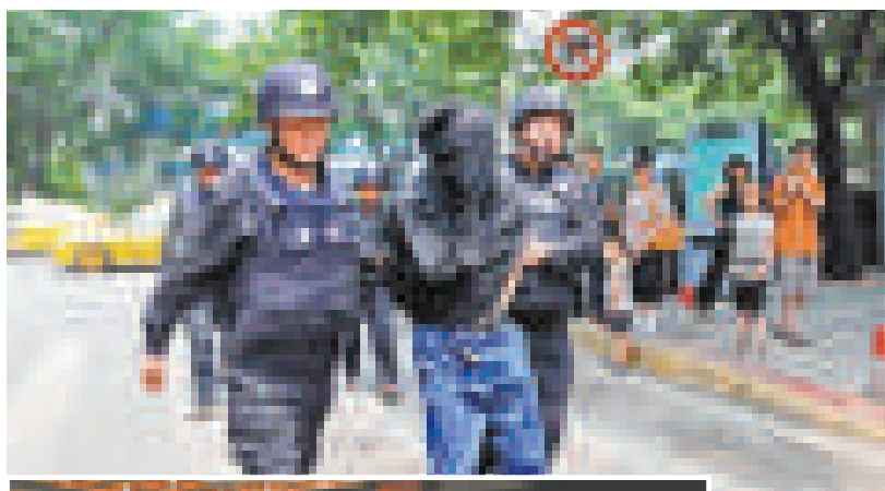
▲警員抓捕黑惡團夥嫌疑人

為開展好此次專項行動，廣東省委省政府成立了以廣東省委副書記朱明國為總責，由省委政法委牽頭協調與6位省領導和55個單位參加的省「三打」專項行動領導小組。