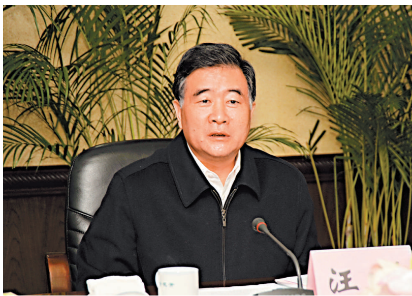
▲汪洋部署廣東開展打擊欺行霸市、製假售假、商業賄賂

在一旁的沙井公園一個山坡，往下望見三棟樓房的門窗已被貼上封條，可以看到裡面設有大型游泳池，以及一個水上高爾夫練習場。在陳先生提供的一張相片中，可以看到該樓房內還有「龍哥專用洗浴室」，門前掛了警示牌提醒清潔工「室內的泳褲、毛巾、游泳