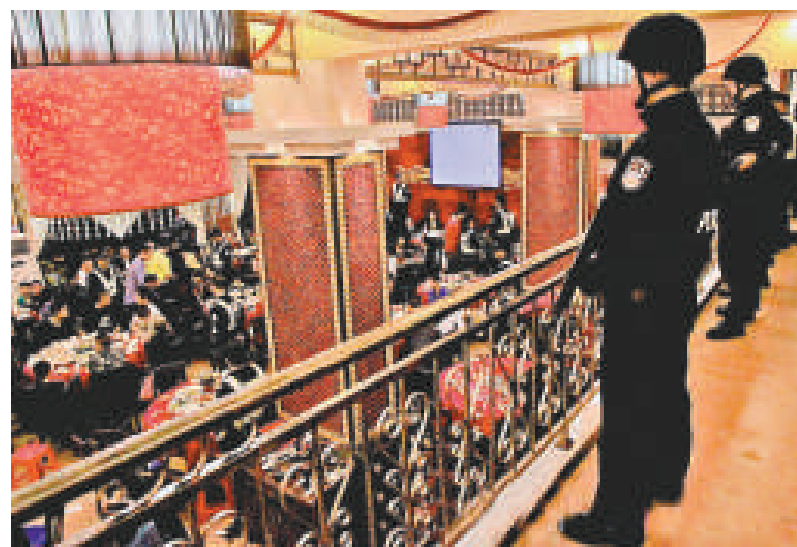
▲2011年11月25日晚，佛山警方突襲位於南海大瀝的一家四川特色酒店

有意思的是，1月初，汪洋不僅部署「打黑」，還大談「唱紅」。他出席廣東省人大會議時即興作對「2011黃華華圓滿謝幕，2012朱小丹漂亮開局，橫批廣東唱紅。」不過，此「唱紅」非彼「唱紅」，且聽汪洋解釋：「什麼意思呢，朱小丹的朱是紅色，是比較激情的顏色，比如股市飄紅大家都高興，中國人也喜歡唱紅，咱們今年也要有個好的開局，所以橫批叫「廣東唱紅。」(本報廣州十日電)