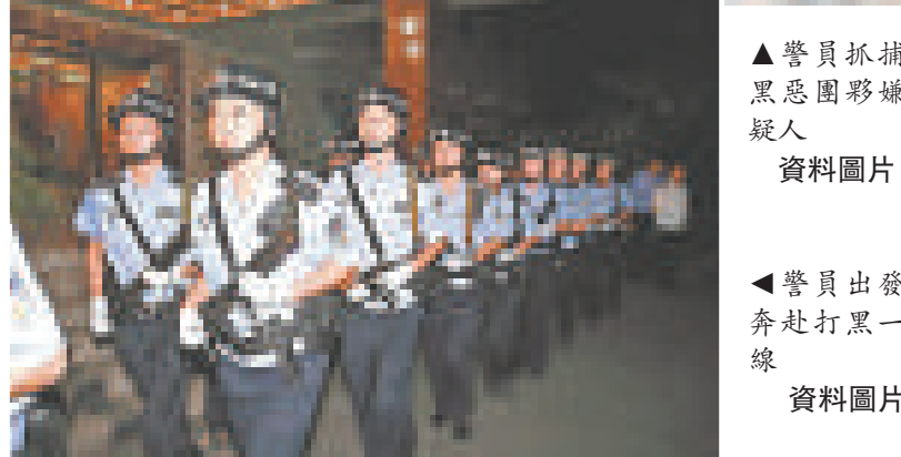
▲警員出發奔馳打黑一線