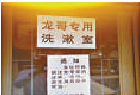
▲黑老大陳某在廢品收購站內游泳池設有專用洗浴室