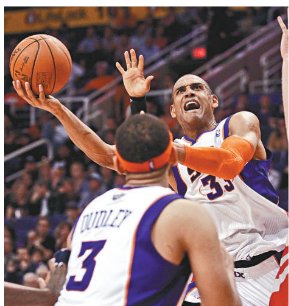
▲習近平訪美期間可能現場觀看 NBA 籃球賽。圖為鳳凰城太陽隊九日進行比賽

雖然外界認為經濟和貿易議題可能是習近平此行的重頭戲，但美國媒體援引中國外交部副部長崔天凱的話說，習近平的出訪將帶給美國一些經濟協議，但大規模的擴大經貿合作並不是此行的主要目的。不能認為這就是去採購，或者去送禮去了。