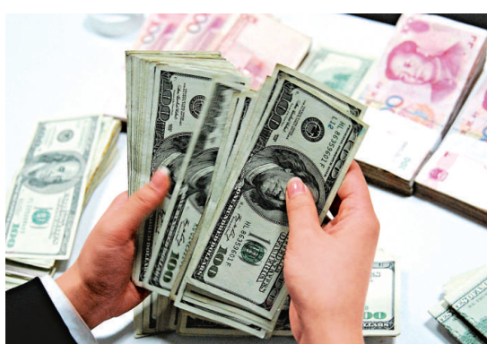
▲中國工商銀行九江八里湖支行的工作人員十日在清點美元。當日，人民幣對美元匯率中間價 6.2937，創下匯改以來新高

據好於預期，紓緩了市場避險情緒，非美貨幣普遍出現上漲；其次，美聯儲延長超低利率時限，導致 QE3 預期重新抬頭，美元匯率回落；第三，中國經濟先行指標連續兩月回升，打消了海外機構做空中國的動力，人民幣升值預期扭負為正。