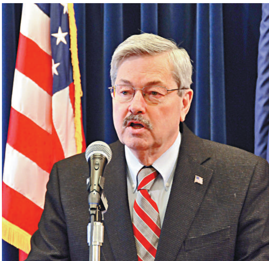
▲美國艾奧瓦州州長布蘭斯塔德八日在州首府得梅因舉行的新聞發布會上講話。布蘭斯塔德日前說，中國國家副主席習近平下周對艾奧瓦州的訪問是一件「令人激動」的大事，將給艾奧瓦州民眾留下「難忘的記憶」