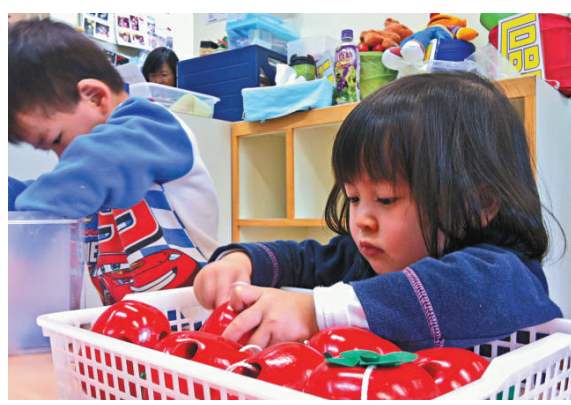
▲專家認為幼兒教育不需要正式的課程而應在遊戲中進行

【本報訊】香港教育學院調查發現，為提高子女升讀小一面試機會，超過七成受訪家長為子女報讀興趣班，有百分之三的家長甚至為此每月花費高達五千元。最受家長追捧的始終是英語課程。