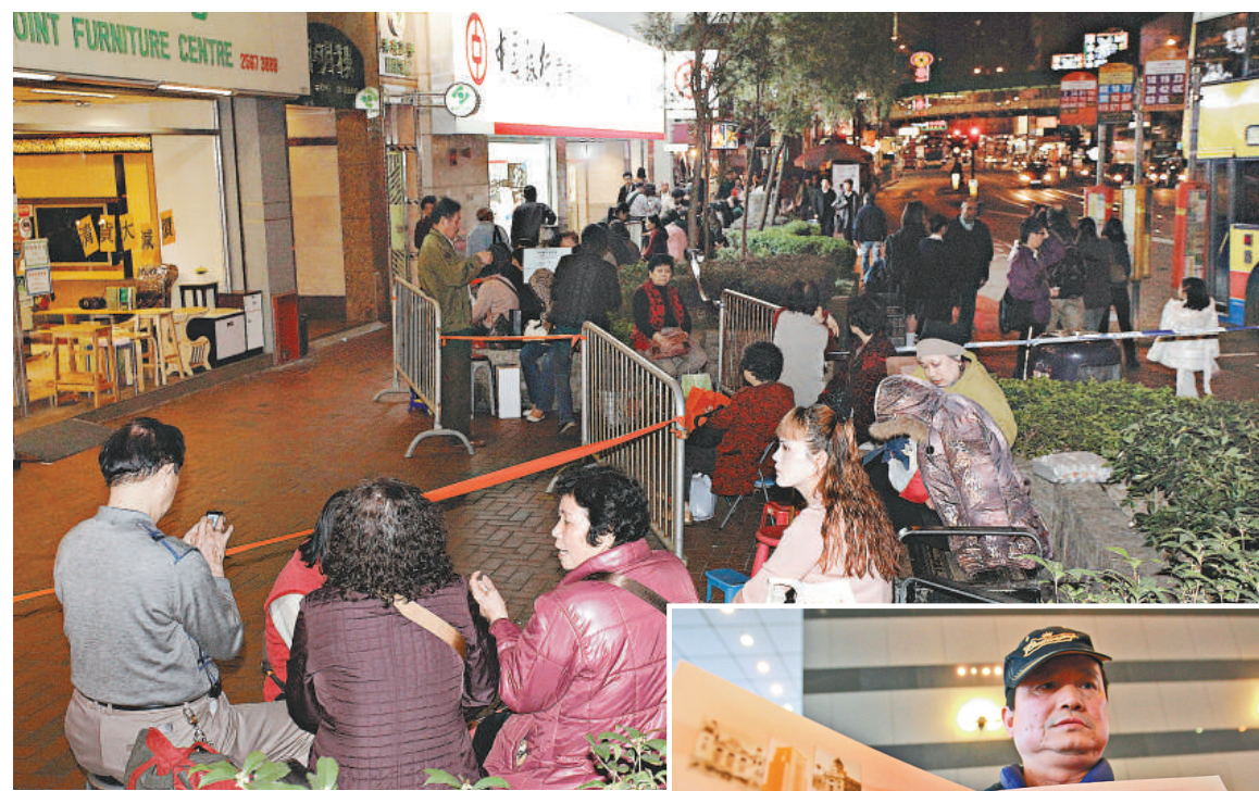
▲中銀紀念鈔昨日開售，吸引大批市民在分行外通宵輪候

當日在銀行開售前有錢幣公司職員到銀行外派卡片，聲稱以近五倍價錢，即七百五十元收購紀念鈔。另有市民表示，有炒家以一千元向她收購一張