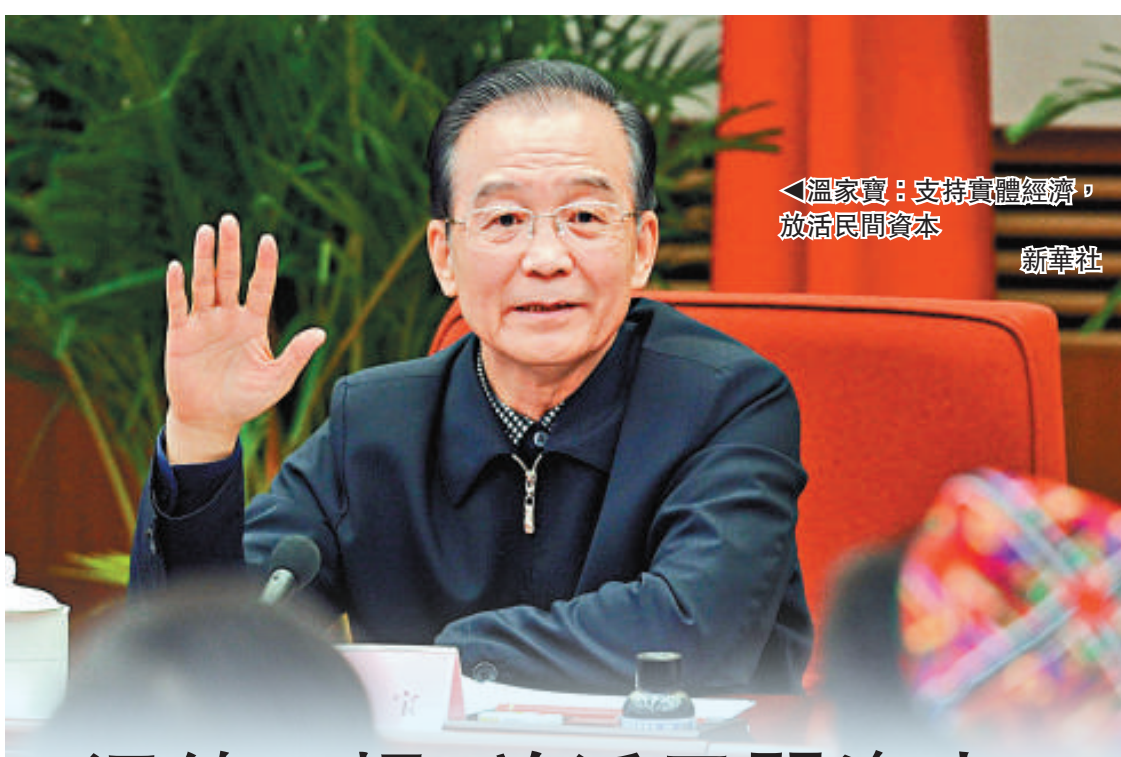
溫家寶：支持實體經濟，放活民間資本

不過，博鰲亞洲論壇國際諮詢委員會委員、原外經貿部副部長龍永圖卻認為，不要過分高估歐美經濟危機對中國的影響，不要自己嚇自己，因為之前我們都認為中國經濟可能不行了，最後我們的還是發展得很好。