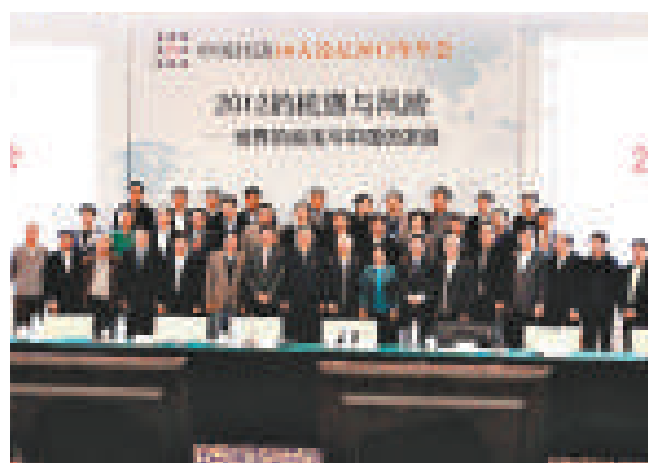
中國經濟50人論壇2012年年會主題是「2012的機遇與風險——世界的動盪與中國的發展」