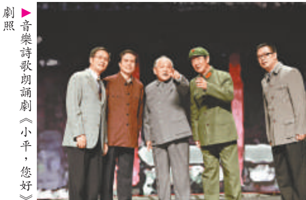
劇照 ▶ 音樂詩歌朗誦劇《小平，您好》