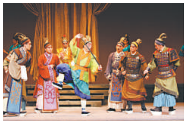
台北新劇團以京劇形式演繹西