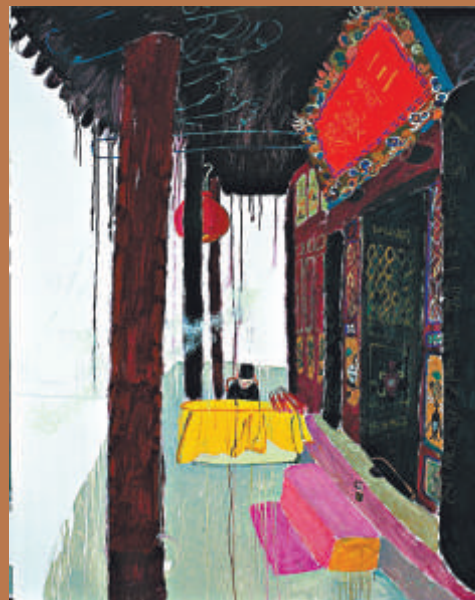
油畫、丙烯《玉泉觀4》二〇〇七