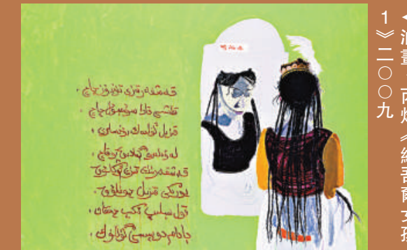
油畫、丙烯《維吾爾女孩1》二〇〇九