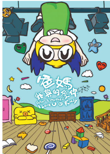
《爸媽我真的愛你》下月上演

【本報訊】近年積極參與本地兒童半面具人偶劇製作的大細路劇團將於三月帶來最新作品《爸媽我真的愛你》。