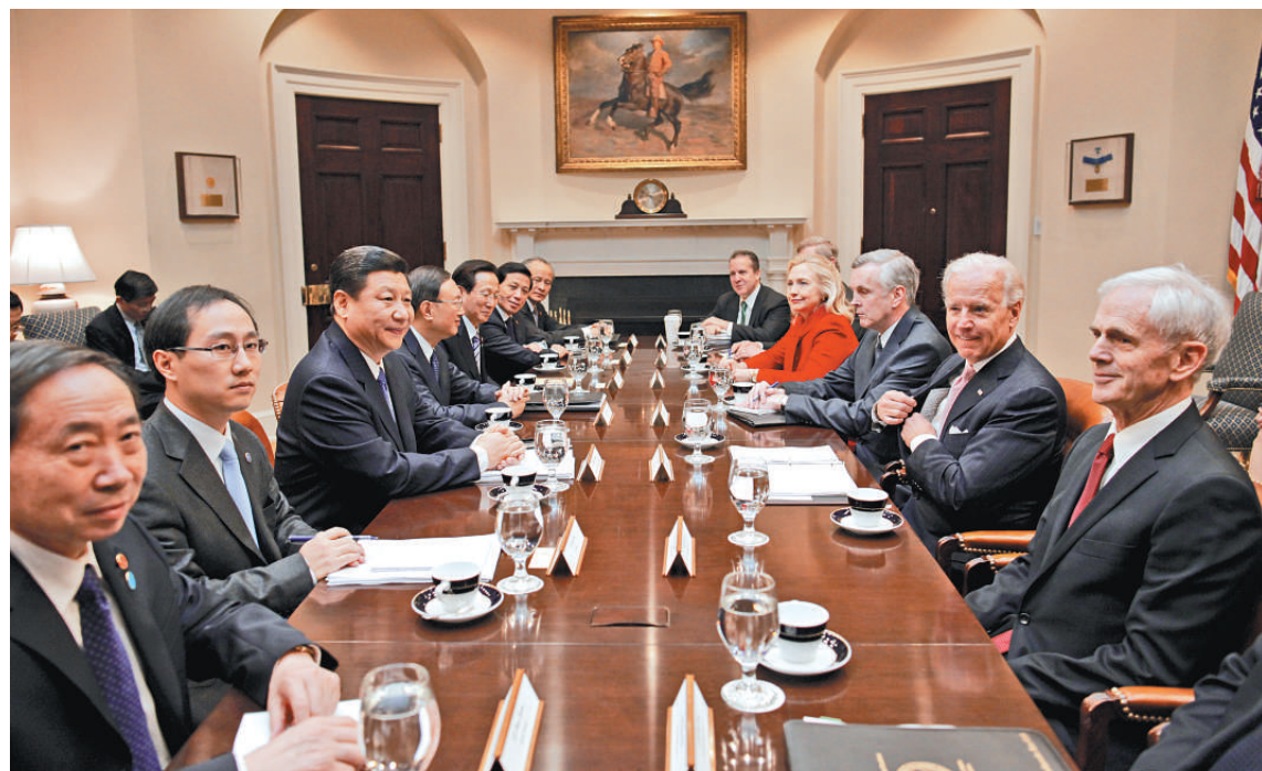
▲ 2月14日，中國國家副主席習近平（左三）在華盛頓白宮與美國副總統拜登（右二）舉行會談

但是奧巴馬也得在兩人初次會面的立場上，保持微妙的平衡。他一方面要留意與中國未來領袖有個平順的開始，但是另一方面得對北京當局表現堅定立場，這是出於11月競選連任的政治需要。共和黨總統參選人和一些美國議員已譴責奧巴馬，在中美貿易與人民幣議題上太過軟弱，他們認為，北京讓人民幣匯率偏低，以保證廉價產品出口，使中國成為製造業超級強國。