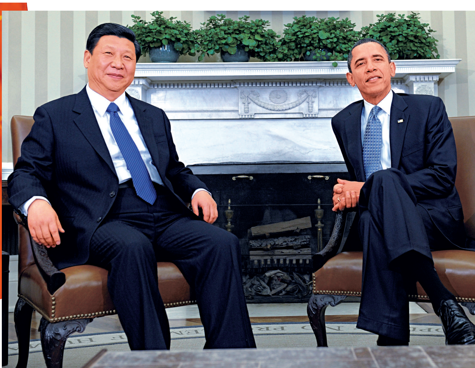
▶ 2月14日，中國國家副主席習近平與美國總統奧巴馬在白宮橢圓形辦公室會談