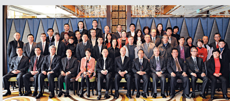
▲澳博昨與三地傳媒舉行春茗聯歡