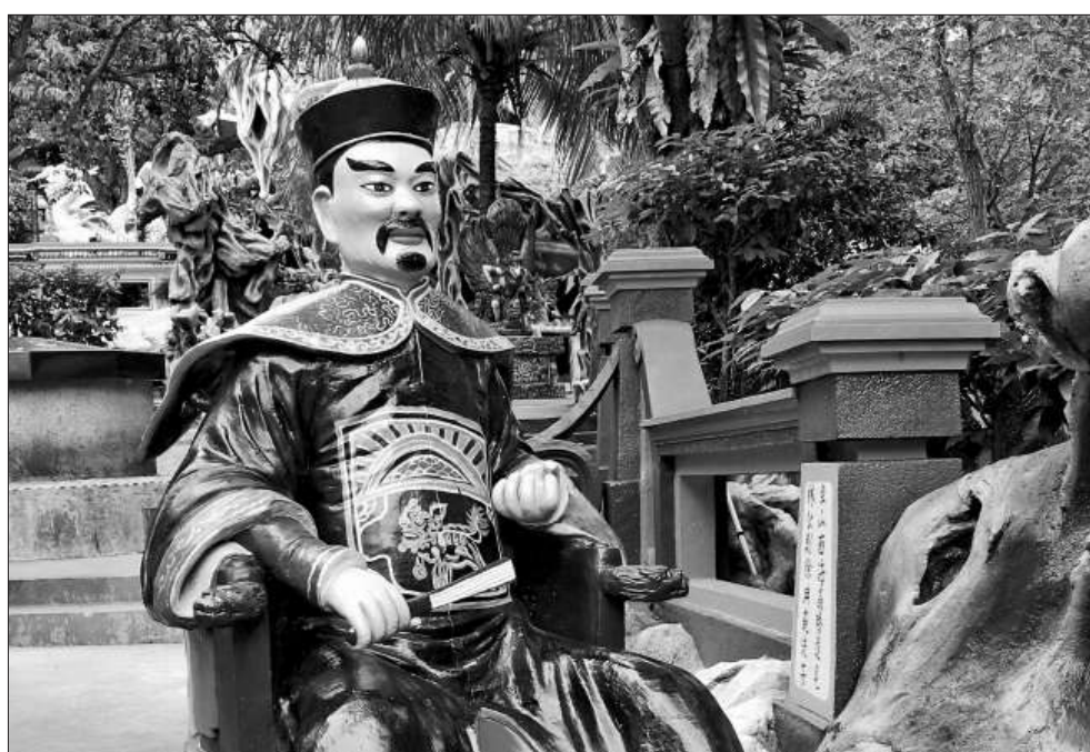
虎豹花園的林則徐塑像