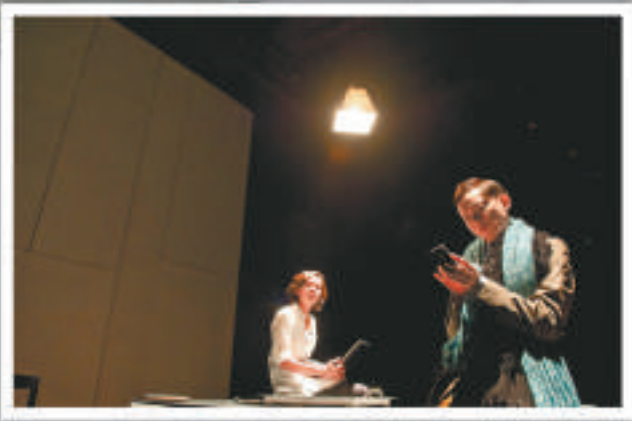
▲《一千零一夜》展現都市情境，盡顯眾生色相