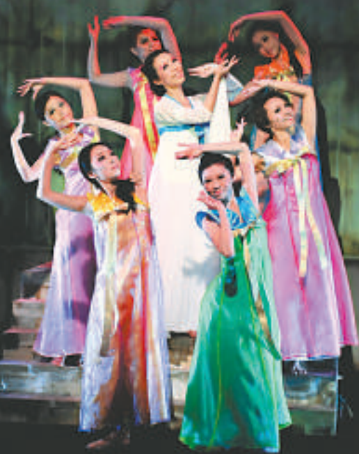
▲《港式愛擁》是一齣以歌舞包裝的愛港宣言，以「梁祝」掀開序幕