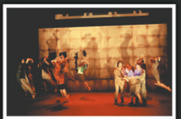
▲「團劇團」成員戮力演出《港式愛擁》