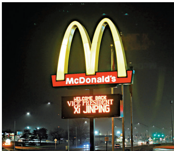
▲馬斯卡廷麥當勞的廣告牌打出歡迎習近平的電子標語

布蘭斯塔德表示，希望以習副主席此次重訪為契機，在艾奧瓦州與中國人民友誼的基礎上，進一步擴大與中國在各領域的交流合作，共同譜寫美中人民友好的新篇章。