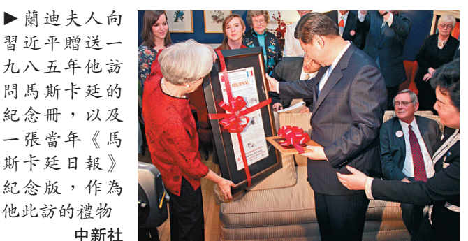
▲蘭迪夫人向習近平贈送一九八五年他訪問馬斯卡廷的紀念冊，以及一張當年《馬斯卡廷日報》紀念版，作為他此訪的禮物