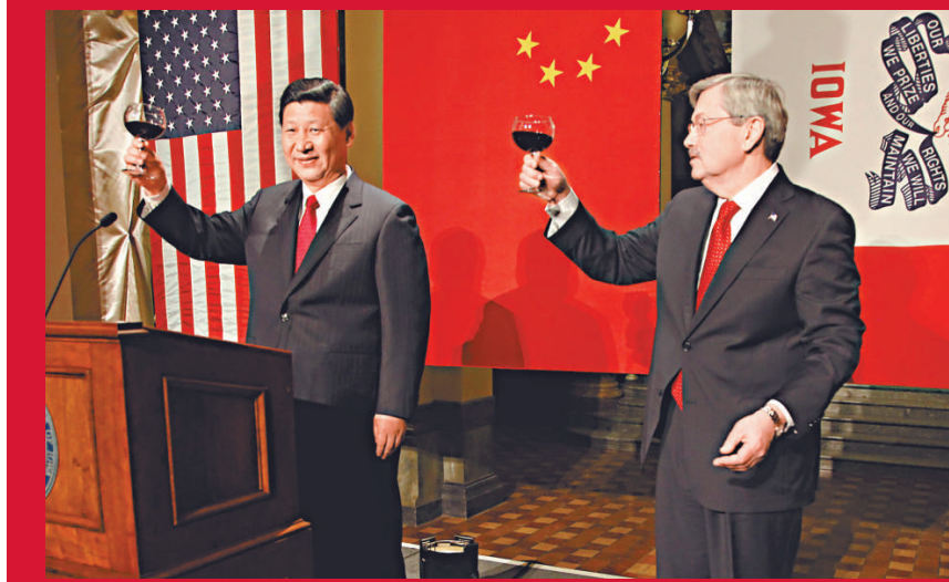
▲艾奧瓦州州長布蘭斯塔德舉行盛大晚宴，隆重歡迎習近平到訪。