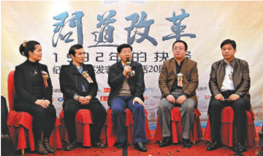
◀樂正(中)透露，深圳年內將公布不少於20項的改革措施

樂正指出，深圳仍然有改革的激情、仍然有改革的勇氣。他表示，深圳將由「經濟體制改革」全面轉向「社會體制改革、政治體制改革、文化體制改革、經濟體制改革」四個領域齊頭並進，因為任何的單兵突進都是突進不了