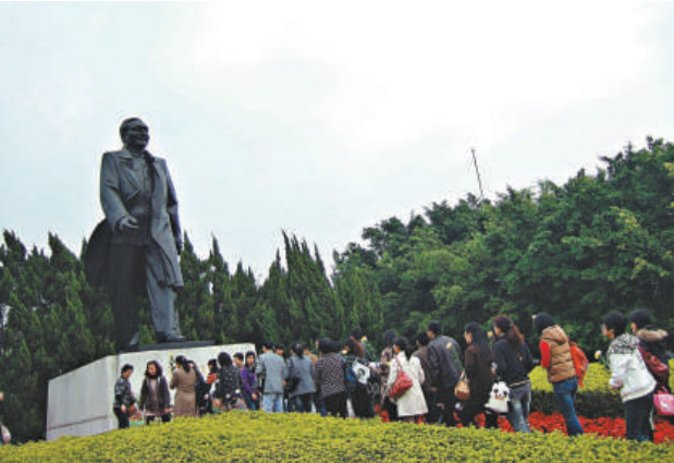
▲市民在蓮花山上瞻仰鄧小平塑像