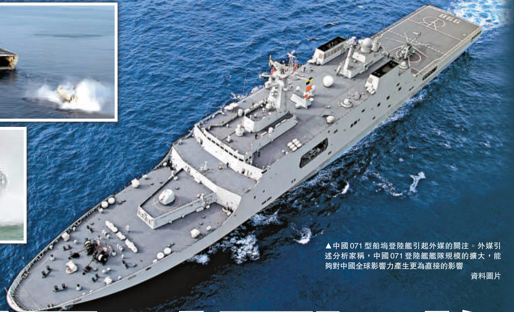
▲中國071型船塢登陸艦引起外媒的關注。外媒引述分析家稱，中國071登陸艦艦隊規模的擴大，能夠對中國全球影響力產生更為直接的影響

【本報訊】路透社日前發表 David Laque 署名文章，重點探討中國海軍071型船塢登陸艦，稱雖然目前外界大都把注意力集中在海試中的「瓦良格」號航母，但軍事分析家認為，中國海軍2萬噸級071登陸艦艦隊規模的擴大，能夠對中國全球影響力產生更為直接的影響。