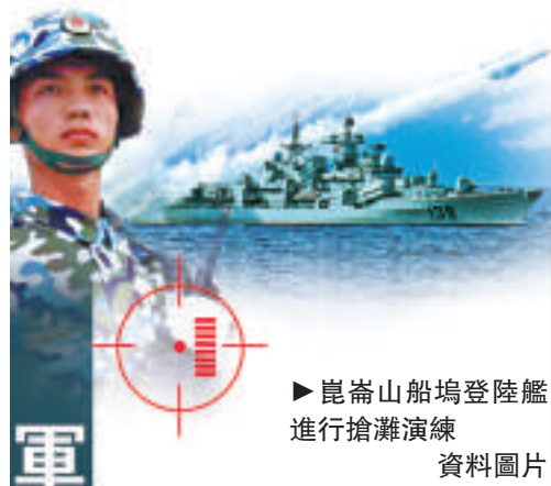
▲崑崙山船塢登陸艦進行搶灘演練 資料圖片