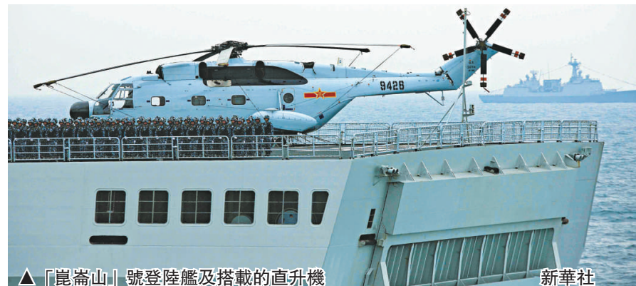
▲「崑崙山」號登陸艦及搭載的直升機

在登陸作戰行動中，該艦主要是從海上進行「平面登陸」。同時該艦還具有直升機運送和攻擊能力，主要作用就是搭載、支援和使用直升機中隊，運送海軍陸戰隊隊員及車輛、裝備和彈藥，從而一定程度上實施「垂直登陸」。