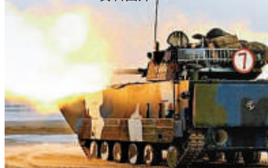
▶登陸艦部隊與海軍陸戰隊聯合訓練 資料圖片

分析家指出，兩棲登陸艦可讓中國部署南海等具有爭議的地區，而對於亞太諸小國而言，這是個不幸的消息。不過，由於中國試圖令地區國家相信其軍力增長不會構成威脅，所以其兩棲登陸艦最初可能會用於增強國家「軟實力」。