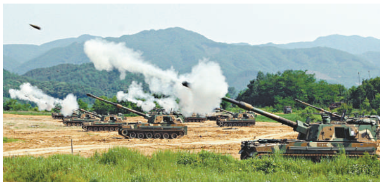
▲2009年6月18日，韓軍K-9自行火炮在Yeonchon進行射擊訓練 資料圖片

【本報訊】據中新社、新華社北京19日消息：朝鮮軍方19日表示，韓國軍方20日在朝鮮西海五島周邊水域進行海上射擊訓練若侵犯朝方領海，朝鮮軍隊將「予以無情的應對打擊」。