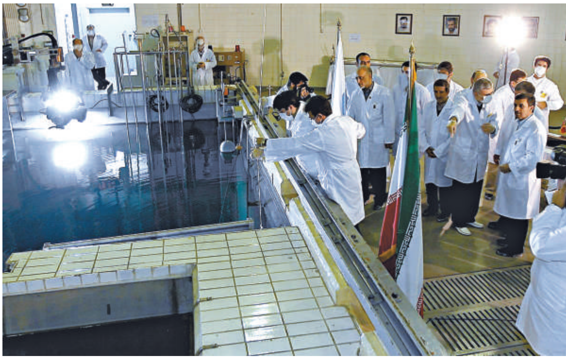
▲伊朗總統府19日發布相片，相片顯示伊朗總統內賈德15日參觀德黑蘭以北的一個核反應堆研究中心

報道介紹說，雖然新協議的條款未被公布，但去年中伊兩國的石油協議表明，2011年伊朗對華出口為每日22萬桶原油及6萬桶的天然氣。伊朗石油部長本週已率代表團訪問中國，就新的原油供應合同及其他石油、天然氣、石化項目與中方磋商。