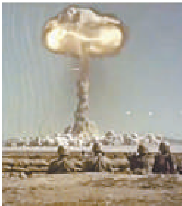
▲美軍士兵近距離觀察核爆炸

影片網址為： http://www.youtube.com/watch?v=Bz9g_r2JnU&feature=player_embedded