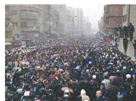
▲敘利亞大馬士革選澤18日舉行喪禮，人權組織表示：死者是被敘軍方槍殺，喪禮後來演變成示威，有15000人冒雪參加

喪禮有超過1.5萬人冒雪參加。活躍分子說，巴沙爾政權的部隊19日亦繼續炮轟中部的衝突熱點城市霍姆斯，殺死至少4人。官方阿拉伯敘利亞通訊社則報道，伊德利卜省有一名檢察官和一名法官被人謀殺。