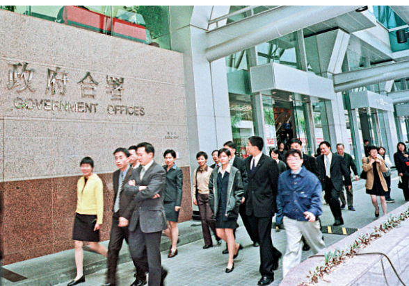
▲政府今年將進行公務員薪酬及入職薪酬水平調查 資料圖片

俞宗怡續指，政府過往共有三次經驗將全部或部分公務員薪酬調低，但都有充分理據。根據慣例，薪酬水平調查有結果後，會諮詢員方的意見及立法會，再向行會提交建議。