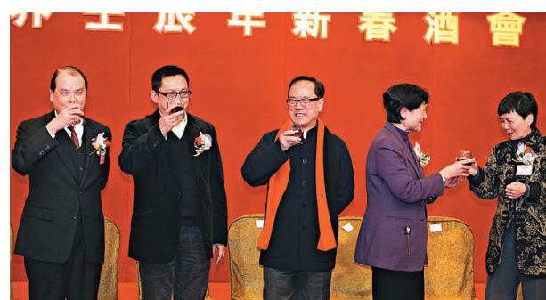
▲(左起)勞工及福利局局長張建宗、工聯會立法會議員葉偉明、行政長官曾蔭權、勞工界立法會議員李鳳英、公務員事務局局長俞宗怡出席勞工界新春酒會。

市民可於政制及內地事務局網頁(www.cmab.gov.hk)下載諮詢文件，或於今日起於各區區政事務處諮詢服務中心索取。市民可在今年四月二十日或之前，以郵寄、傳真或電郵方式遞交意見。