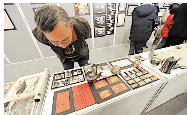
▲香港百年發展珍藏展昨日揭幕

他又表示，財政司司長在二〇一二至一三年度《政府財政預算案》中提出，政府將邀請香港科技園公司研究擴展元朗工業邨的可行性，涉及土地面積約十六公頃，政府亦會繼續物色土地供香港科學園和工業邨持續發展。