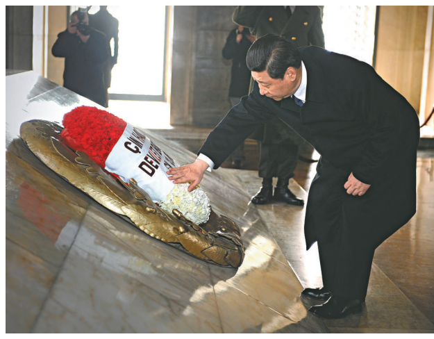
▲習近平二十一日在安卡拉向土耳其國父凱末爾陵獻花

由此可見，中國和土耳其在阿拉伯世界擁有眾多利益合作交集。她又強調說，中國在中東的石油以及北非的投資利益需要更多借重土耳其的力量保護，相信未來中土可逐漸解決貿易不平衡問題，最終實現區域利益雙贏。 【本報北京二十一日電】