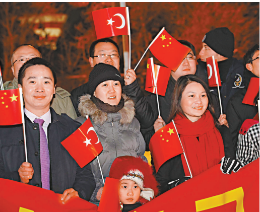
▲習近平二十日晚抵達安卡拉對土耳其進行正式訪問。華人華僑手持兩國國旗歡迎習近平來訪

除了地區局勢，習近平此行將重點尋求加強雙邊貿易合作。土耳其官員稱，中國和土耳其可能會探討核電站方面的合作。一名官員告訴當地媒體：「正式談判還沒有進行，但中方此前表示對土耳其核電領域的興趣。」這名官員透露，中國可能會為未來進軍土耳其能源領域建立一個聯合信貸基金。這一基金將幫助中國企業在其他國家投資。