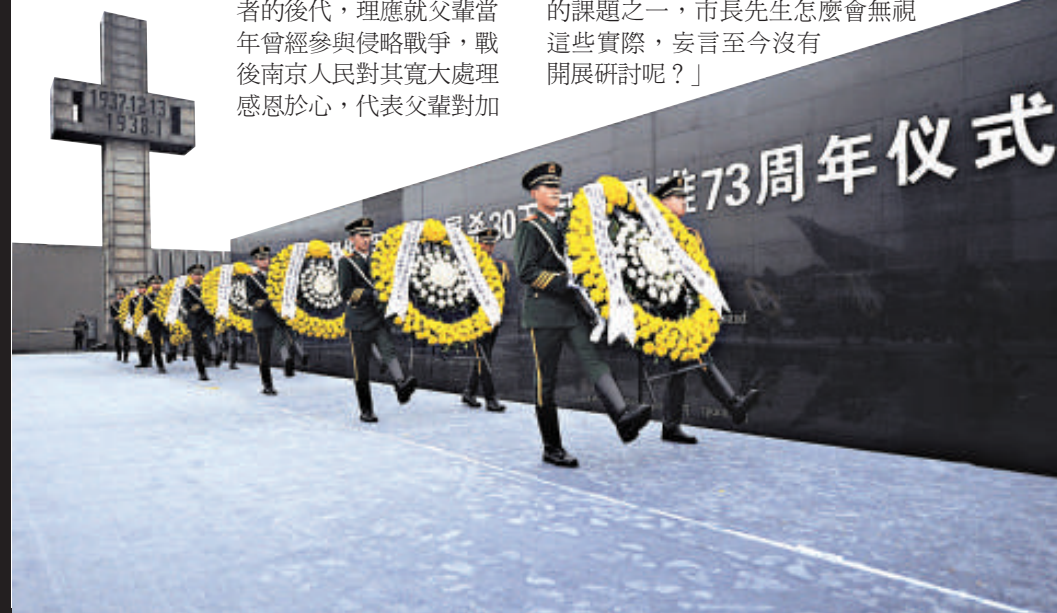
▲南京每年舉行集會悼念南京大屠殺30萬同胞遇難，圖為武警戰士向遇難同胞敬獻花圈 資料圖片

朱成山在信中駁斥河村隆之說，「你作為日本名古屋市長，以自己的父親戰時體驗的傳言為依據，多次否認南京大屠殺歷史，我認為這是極其荒謬的。眾所周知，侵華日軍對中國人民犯下過種種不可饒恕的罪行，特別是南京大屠殺罪孽深重。作為侵略加害者的後代，理應就父輩當年曾經參與侵略戰爭，戰後南京人民對其寬大處理感恩於心，代表父輩對加害者的民衆作真誠的道歉。可你卻反其道而行之，簡直不可理喻！」 朱成山指出，「多年來，南京市曾經在世界各地，包括日本在內徵集和保存着大量南京大屠殺歷史的人證、物證和歷史檔案(含文字、音像)資料，清楚地說明南京大屠殺歷史事實的客觀存在。戰後，遠東國際軍事法庭和同盟國南京審判軍事法庭對甲級、乙級和丙級戰犯審判過程中，均涉及到南京大屠殺的調查和認定，都曾經對南京大屠殺有過歷史的定論和法的定性。雖然時隔多年，但至今不容許否認和抹殺。」他同時質問道：「中日兩國關於南京大屠殺歷史的研究，早在上世紀八十年代就開始了。日本歷史學家洞富雄、藤原彰、吉田裕等諸多日本學者多次來南京，進行實地調查研究，與中方學者進行學術交流和研討，多次召開過有數十名日本教授學者參加的南京大屠殺史國際學術研討會，特別是近年來開始的中日雙方歷史問題研究中，南京大屠殺歷史是其中的課題之一，市長先生怎麼會無視這些實際，妄言至今沒有開展研討呢？」