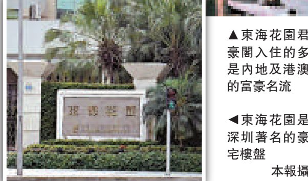
▲東海花園君豪閣入住的多是內地及港澳的富豪名流