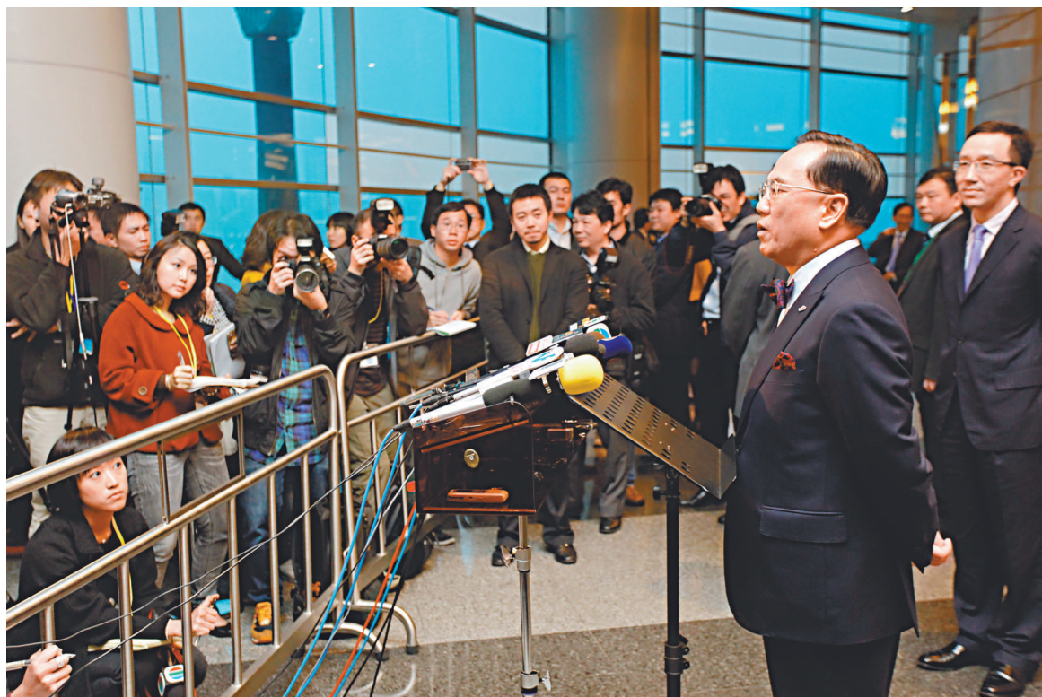
曾蔭權昨日主動向傳媒交代外遊事件

就曾蔭權近日乘坐遊艇從澳門返港一事，曾蔭權承認，早前曾在朋友遊艇上留宿，但否認接受豪華款待：「的確確確我係船上過夜，亦都因為保安問題，我想離開繁囂地方，所以唔住得酒店，因為喺咁地方太嘈，而有機會朋友邀請我，我就去住……我係船上只係食咗個早餐，早餐就係水果、豬骨粥、油麵，就是咁，船上唯一嘅娛樂就係電視新聞，無卡拉OK，無特別表演，更加無任何賭博。」