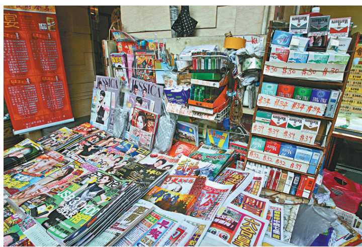
▲報販團體指，報販售賣香煙的生意大減兩成

外傭居權上訴案昨繼續聆訊，代表外傭的大律師李志喜展開陳詞指，本港於回歸前有自主權決定任何人士在本港獲得居留權，惟回歸後基本法成為憲法，政府即使修訂任何法例，都不可以抵觸基本法，否則就會凌駕在憲法之上，又指基本法二十四條列明，中國公民居港滿七年可獲居港權，但於同一條文內提及的外國公民，亦為居住滿七年可獲居港權，不應加入資格限制。