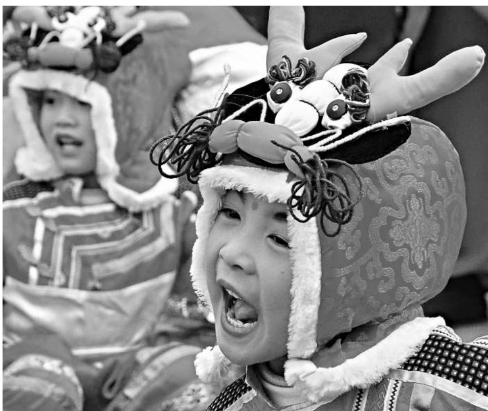
◀「龍抬頭」這天，一名幼兒在古都河南開封表演舞蹈《龍娃躍龍門》

中國巨幅藝術大師孫磊在2012中國·西柏坡文化旅遊節開幕式上現場揮動3.5米長、1.4米寬、重35.8公斤巨筆在2178平方米的紅錦緞上寫下66m×33m的巨大「龍」字。據悉該字將申報世界健力士紀錄。