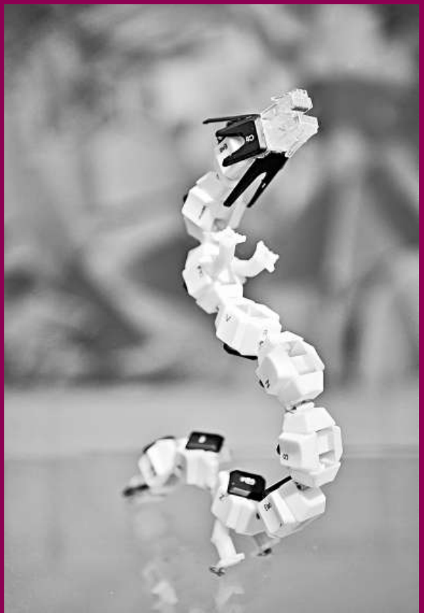
「二月二，龍抬頭」，龍這祥瑞符號再次成為23日的主角。今天有孩子受風俗之「累」被「剃龍頭」，在眼淚中為今年討個好彩頭（左圖）；亦有廣西書畫家「借舊題，展愛心」，義賣「龍」字，替貧困學生籌助學資（上圖）；而北京首都博物館展出的用電腦鍵盤製作的龍形作品（右圖），又在傳統中注入現代科技的色彩