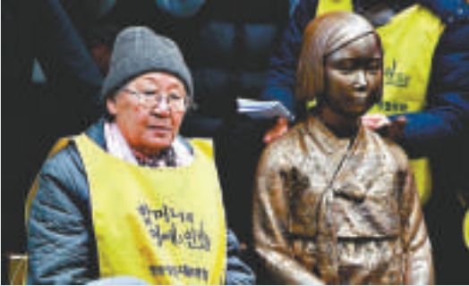
▲2011年12月14日，日本駐韓國使館外，韓國慰安婦倖存者與「和平碑」少女雕像 資料圖片

在委員會整理的介紹文章中寫道，戰壕內除了日軍官兵，還有「沖繩縣職軍人及學徒、女性文職軍人及慰安婦等雜居此處」，但縣政府刪除了慰安婦一詞。此外，文章中還寫道，「司令部戰壕周圍還發生了日軍對被視為奸細的沖繩居民的屠殺」，但縣政府決定不放入這句話。據悉，該戰壕總長在1公里以上，內部崩塌嚴重十分危險，因此並未向公眾開放。沖繩縣政府認為，「希望讓大家知道當年陸軍司令部設在首里城地下」，故而決定設置介紹牌。