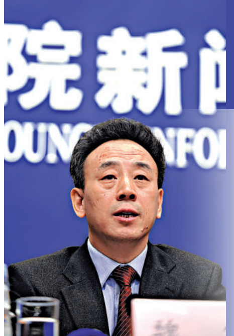
▲魏宏在記者會上答問

他還表示，政府高度重視對災後恢復重建資金的監管。國家審計署先後九次發布對抗震救災錢物的審計和恢復重建資金的跟蹤審計的社會公告，認為四川災後恢復重建的資金監管規範，做到了專帳管理，專款專用，沒有出現和發生重大的問題。