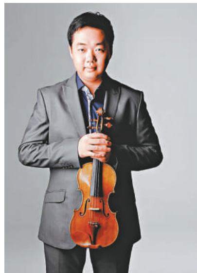
◀小提琴家寧峰將展開全國巡演