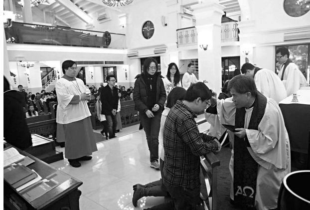
諸聖聖堂舉行大齋首日的塗灰禮