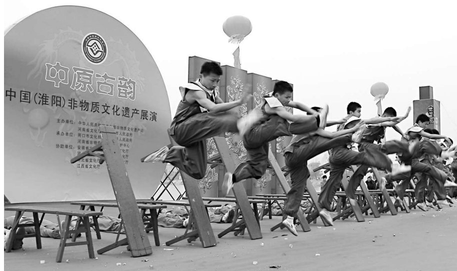
▲河南登封少林塔溝武術學校代表團表演的國家級非遺項目《板橋龍》