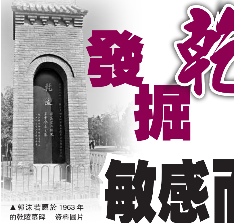
▲郭沫若題於1963年的乾陵墓碑

在中國歷代帝陵中，乾陵是最特殊的一個：它是全國唯一的兩個帝王合葬墓。一男一女，一個是大唐的高宗皇帝，一個是大周的則天皇帝。自公元706年5月18日武則天與丈夫李治在此合葬後，距今已1300多年。陵內地宮中藏着大量的珍寶和秘密，堪稱「世界第九奇蹟」。金銀珠寶，讓雞鳴狗盜之徒饞涎欲滴；文史秘秩，則令文人學者望眼欲穿。誰不想在有生之年一睹乾陵地宮中的奇珍異寶？乾陵能否發掘？何時發掘？ 文：孟西安