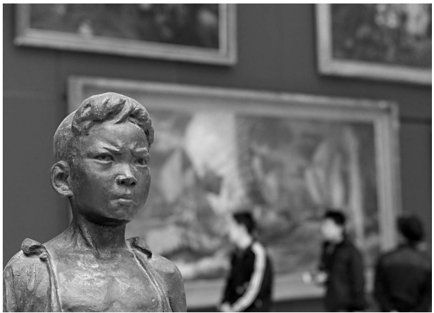
▲國家博物館1日在京正式開館，圖為館內一角

國博方面表示，正式開放後的中國國家博物館，將繼續做好「古代中國」和「復興之路」兩個基本陳列的豐富和完善工作，繼續做好和完善高品質的專題展覽。努力把國家博物館建設成為在國內外具有廣泛聲譽和影響力的文化和學術交流平台，充分發揮國家博物館文化軟實力的重要窗口作用。