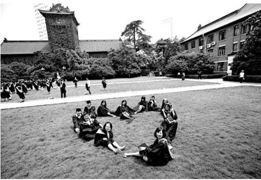
▲南大110周年校慶將按「序長不序爵」的原則接待校友，圖為畢業生在南大標誌性建築北大樓前草坪上留影

程」重點支持大學；1999年，南京大學進入國家「985工程」首批重點建設的高水平大學行列。