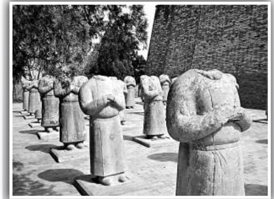
▲守護乾陵的無頭蕃臣像

公元880年，農民起義軍首領黃巢破潼關、入長安，稱齊帝，公元706年派大將王璠盜掘乾陵。王璠出身書香之家，稍長又舞槍弄棒，十八般武藝大都精通，兼備文韜武略。因痛恨朝廷的腐敗統治和官場的黑暗，他投靠黃巢起義軍，立下了赫赫戰功，成為黃巢的心腹愛將。王璠領命後，駐軍乾陵，經過反覆勘察，下令士兵從梁山主峰西南方進行開挖，經過幾個月的挖掘，也未找到乾陵地宮的出口，只留下一條小溝岔——「黃巢溝」。