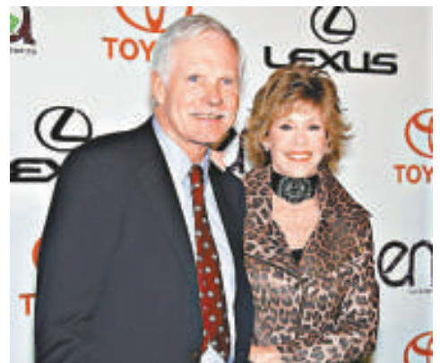
▲ CNN創辦者泰德·特納與第三任妻子、奧斯卡影后珍芳達

【本報訊】據英國《每日電訊報》29日報道：美國有線電視新聞網（CNN）創辦者泰德·特納（Ted Turner）日前自曝擁有4名女友，每人每個月陪他一周。