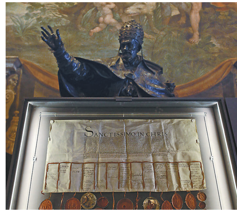
▲ 取消英國國王亨利八世與王后凱瑟琳婚姻的請求書2月29日在羅馬展出

梵蒂岡國務卿貝爾托內樞機主教出席了展覽開幕式。他說最令人印象深刻的，是關於羅馬教皇庇護十二世在二戰期間的一些「歷史真相」文件。庇護十二世一直以來被猶太團體詬病，但新公開的機密文件顯示，他曾對遭迫害的猶太人伸出援手。