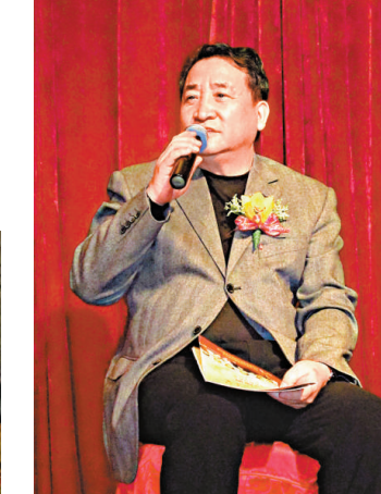
▲姜昆對相聲的發展信心十足