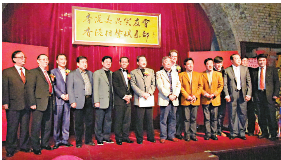
▲姜昆率領相聲名家昨晚在大舞台為香港相聲俱樂部成立慶典表演