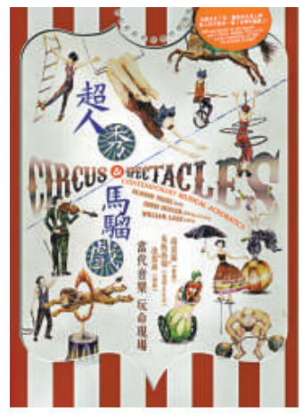
▲多媒體作品《超人秀·馬騮戲》海報

門票於城市電腦售票處發售。三月十七日設演後藝人談；另設免費導賞遊及《音樂·媒體·新體驗》工作坊。查詢節目及有關活動詳情，可電二二六八七三三三。