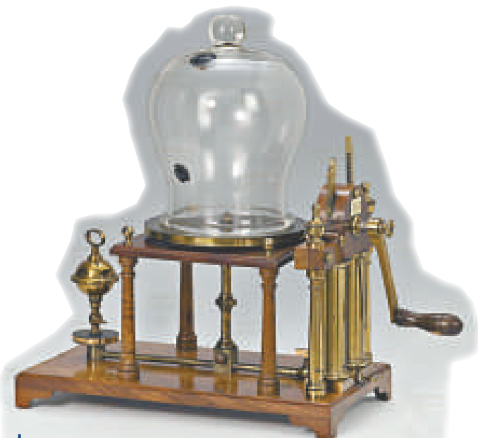
真空泵實驗 (An Experiment on a Bird in the Air Pump), 1769