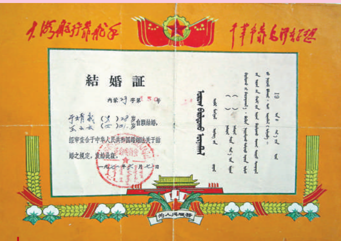
七十年代初期內蒙古某地結婚證