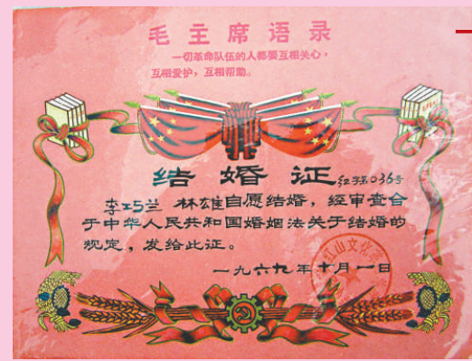
「文革」時代的結婚證