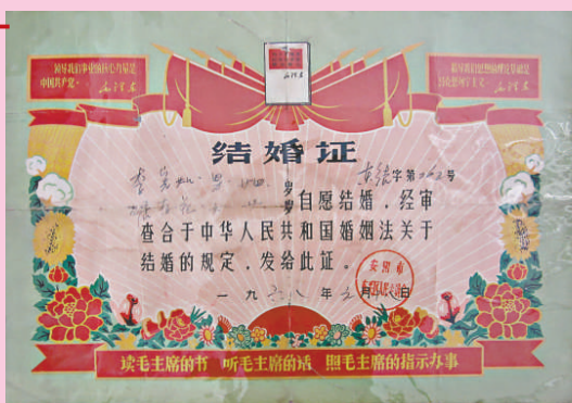
「文革」時代的結婚證