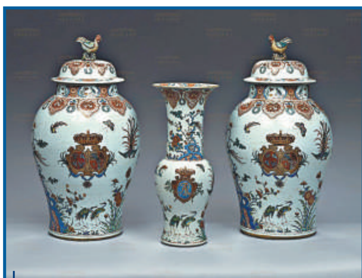
三件式出口瓷花瓶 景德鎮，約1720-1725年前後在荷蘭手繪 德累斯頓國家藝術收藏館，瓷器收藏館