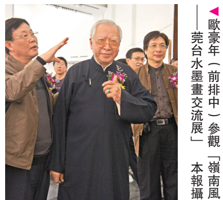
▲歐豪年（前排中）參觀「嶺南風——莞台水墨畫交流展」

【本報訊】實習記者王悅東莞報導：台灣嶺南畫派巨擘歐豪年日前在「嶺南風——莞台水墨畫交流展」上表示，希望兩岸大家的嶺南畫派畫家能有更多互動交流，只要大家聯手，有信心能讓中國畫風在世界畫壇上佔據一席之地。歐豪年同時鼓勵兩岸畫家拓展、豐富嶺南畫派的繪畫題材。 歐豪年祖籍廣東吳川，早歲離鄉移居香港，十七歲師從嶺南畫派大師趙少昂，深得嶺南派繪畫藝術真傳。歐豪年於一九六八年赴台灣授徒，一九七〇年定居台灣。台灣畫院執行院長馮儀表示：「今藝壇新秀，多出其門，對台灣的美術教育及藝文發展，貢獻良多。」歐豪年的作品在世界各地展出，備受推崇，是台灣嶺南畫派的代表，寶島畫壇執牛耳人物。 在畫展和隨後進行的研討會上，歐豪年屢次提及應「拓展題材」。歐豪年建議兩岸畫家可關注「草」等平時被忽視的題材，讓畫作更貼近時代特徵，引起更多觀眾的共鳴。他還建議畫家應更多注意繪畫內容和周圍環境的相互聯繫，「日月星辰的變化要在畫作中體現出來」。