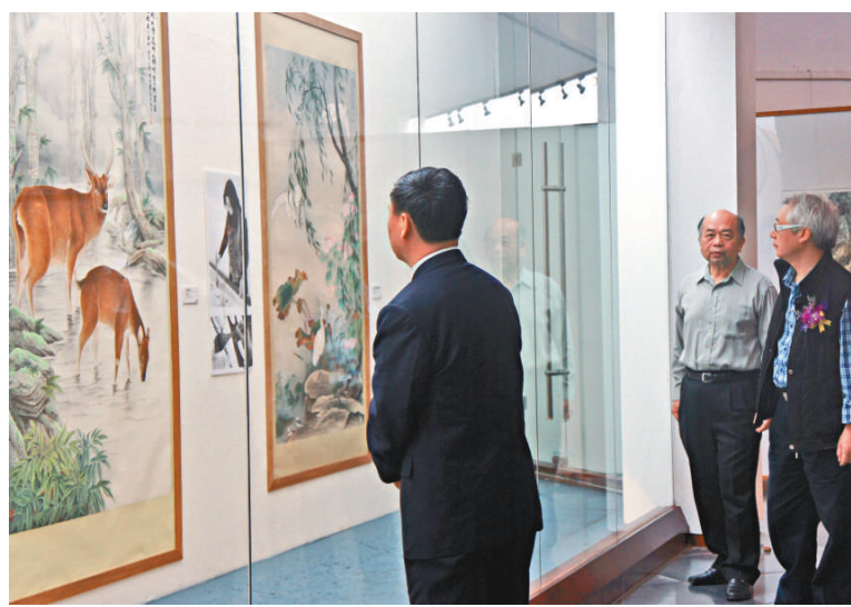
▲畫展展出了莞台兩地五十位畫家的一百幅作品