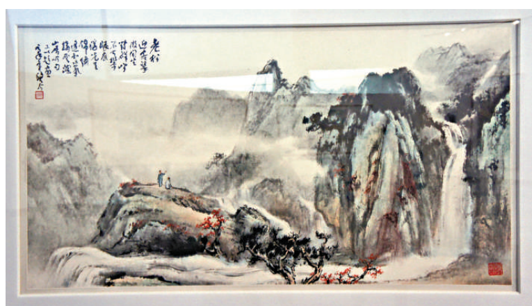
▲歐豪年畫作《老松迎客》

本次畫展特設兩個展場，三月六日至十七日在主展場嶺南美術館展出，之後將移師東莞展覽館，展至三月二十五日。而在展覽之餘，亦有一系列在莞的莞台交流藝術活動，包括「莞台書畫雅集」，邀請了嶺南畫派名家與台灣代表團畫家現場創作；而「東莞景 台灣情——寫生創作探風活動」亦於三月七日至十日期間在東莞地區各知名景點開展。