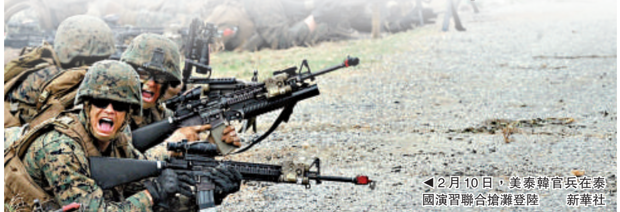
▲2月10日，美泰韓官兵在泰國演習聯合搶灘登陸

另外，在國家發展戰略方面，要按照既定方針大力推進經濟結構調整和產業升級，擴大內需，減少對外部市場和資源的依賴；要大力推動教育和科技發展，盡快建立創新型社會，增強經濟發展的內生動力；要推進社會事業發展，緩和社會矛盾，增強國民對國家政權的向心力和國民的自豪感和自信心。