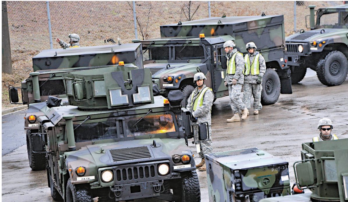
▲3月6日，美韓聯合軍演進入裝備運輸階段，美國士兵參加裝卸演習