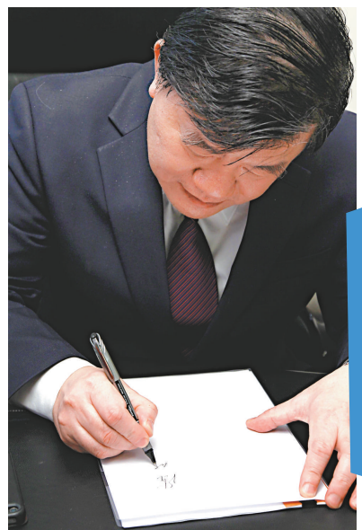
▲陳竺為本報簽名 ▼3月份，四川南充啓動貧困白內障患者復明工程

今年政府工作報告提出，大力推進醫改仍是中國今年重點工作之一。新醫改實施三年來，覆蓋城鄉全體居民的基本醫療保障制度框架初步形成。職工基本醫療保險、城鎮居民基本醫療保險和新型農村合作醫療三項基本醫保參保人數達到13億，覆蓋95%以上的城鄉居民。