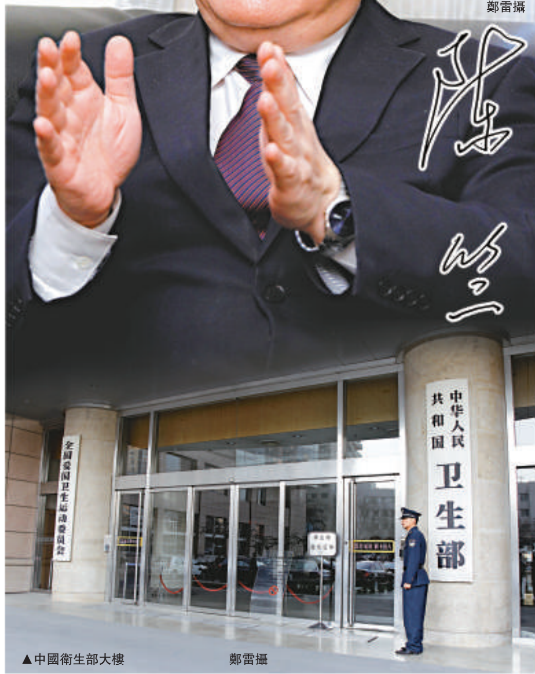
▼陳竺的簽名