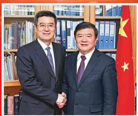
中國衛生部部長 陳竺

2009年啟動的「新醫改」惠及13億人，成為中國政府重大的民生工程。近日在接受大公報總編輯賈西平專訪時，衛生部部長陳竺表示3年來他自己在醫保、特別是農村醫保着力最多。醫保制度在此輪醫改中處於根本位置，既讓百姓享受到健康效益又激活了醫療機構活力，還有利於民營醫院的發展，起到「一石多鳥」的效果。