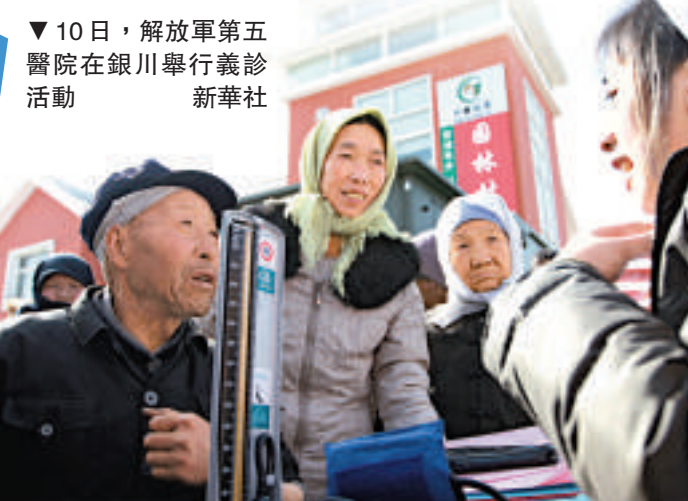
▼10日，解放軍第五醫院在銀川舉行義診活動