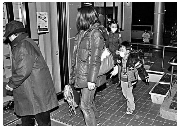
▲日本岩手縣居民在海嘯警報發出後緊急疏散至公共避難場所

據地震研究機構表明，東京直下型地震在未來4年內發生的幾率為70%，一旦地震發生，東京震度將為7度。直下型地震是指震央位於大城市下面的地震，這個名詞由日本學者提出，這種地震的強度一般達里氏6級以上，會對大城市構成直接威脅，造成的人命傷亡和經濟損失