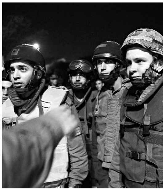
▲以色列士兵13日在加沙地帶接受命令

獨立組織World Public周二公布的調查結果表明，大多數美國人不支持對伊朗可能採取的軍事行動，他們認為，美國應該保持中立並繼續施加外交壓力。