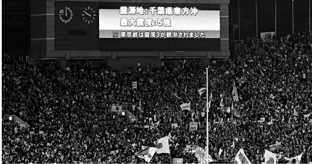
▲剛結束一場球賽的東京體育館內，大屏幕上顯示出地震警告

日本剛於上週日舉行了紀念「3·11」大災難的活動，含淚的家人在城鎮和村子聚會，哀悼地震和海嘯中的死難者。