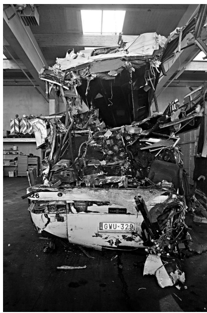
►發生車禍的巴士車頭嚴重毀爛變形

數據顯示，瑞士上一次發生死傷嚴重的交通事故是在2001年10月24日，當時兩輛卡車在哥達隧道內相撞起火，造成11人死亡。瑞士是著名滑雪勝地，每年都有很多歐洲人前往瑞士滑雪。瑞士地處歐洲阿爾卑斯山脈，三分之二的國土都是山地，高速公路經常要在隧道中穿過。