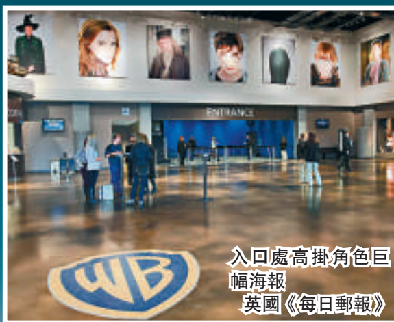
入口處高掛角色巨幅海報 英國《每日郵報》