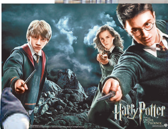
▲《哈利波特》電影已告終結 互聯網