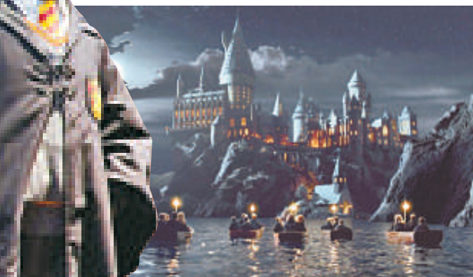
▲電影中的霍格華茲城堡（上）與霍格華茲城堡模型（下）對比