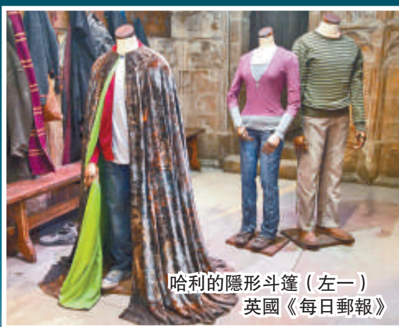
哈利的隱形斗篷（左一）