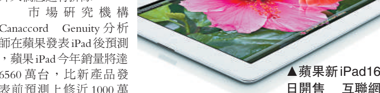
▲蘋果新iPad16日開售 互聯網

【本報訊】據中央社三藩市15日消息：蘋果公司最新iPad將在16日開賣，料將緊抓對平板電腦市場的控制。有分析師預測，iPad銷量今年可望達6560萬台。外界引頸期盼的第三代iPad上周由庫克發表，並在15日開放預購、16日開賣。預計成群的科技迷將包圍各蘋果門市搶購新iPad。蘋果香港店前日已表示在網上已預訂的顧客才可在明日起到iC旗艦店取貨，但仍有數十名市民在iC店外天橋底通宵排隊。市場研究機構Canaccord Genuity分析師在蘋果發表iPad後預測，蘋果iPad今年銷量將達6560萬台，比前產品發表前預測上修近1000萬台。他們並將2013年iPad銷售量預估從7970萬台上修至9060萬台。分析師華克里表示：「由於我們發現新iPad預購量創下紀錄，且到貨需等2到3周，我們預期本周末新iPad的銷量會創空前佳績。我們認為，蘋果在快速增長的平板市場已擴大領先優勢，新iPad使平板競爭更趨白熱化。」