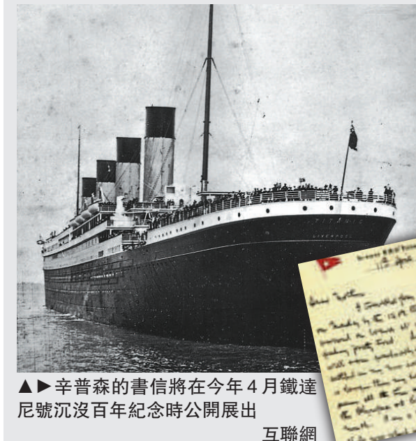
▲辛普森的書信將在4月鐵達尼號沉沒百年紀念時公開展出 互聯網