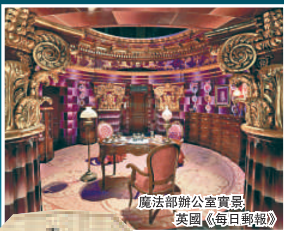
魔法部辦公室實景