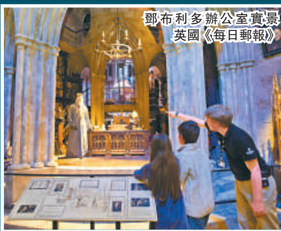
鄧布利多辦公室實景