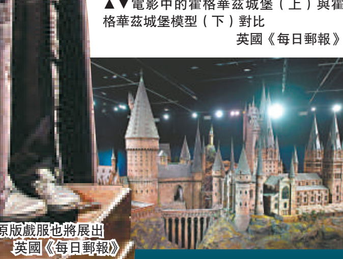
▲原版戲服也將展出