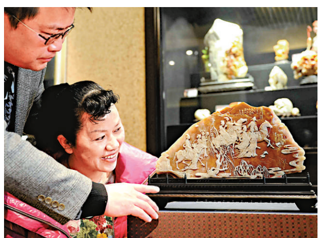
▲近年來，隨著海峽兩岸文化的廣泛交流，一些壽山石名家精品也逐步從台灣回流到中國內地，從而引發了新的壽山石收藏熱潮

負責監管電子商務的通訊傳播委員會(NCC)指出，垃圾郵件長期氾濫，政府機關近10年來都想要立法規範，該部門法務處委員黃文哲表示，草案採取「默示拒絕」機制，收信人必須「明示」同意繼續收信，否則就是拒絕收信，發信人不得繼續寄送商業電子郵件。