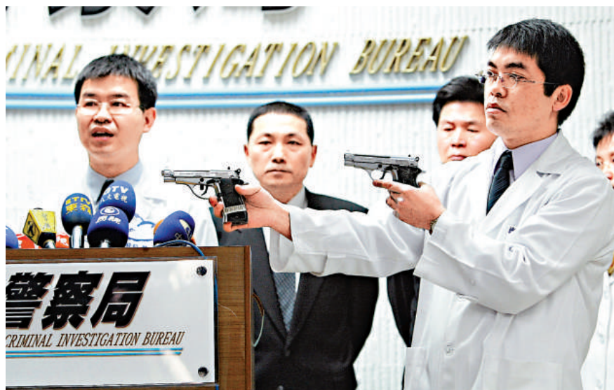
▲台灣特偵組目前正重新調查319槍擊案。圖為2004年底檢方公布涉案同型槍枝及子彈 資料圖片

另外，也諮詢各專業領域專家證人，研商扣案證物送鑒定事宜共計30次，檢送證物至各鑒定機構鑒定6次；特偵組承辦檢察官、檢察事務官先後親自到案發現場及相關處所共計22次；調取錄影帶、光碟共290卷(片)勘驗。