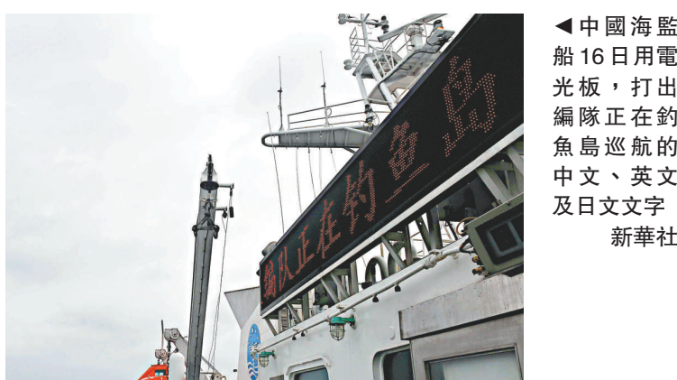
▲中國海監船16日用電光板，打出編隊正在釣魚島巡航的中文、英文及日文文字