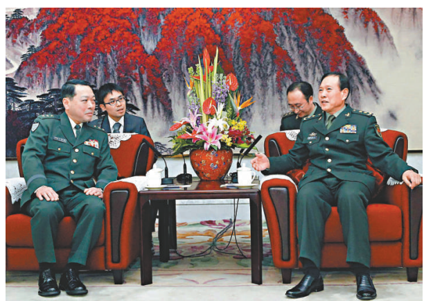
▲16日，中國人民解放軍副總參謀長魏風和（右），在北京八一大樓會見日本陸上自衛隊中部方面隊總監荒川龍一郎一行

吉林省副省長陳偉根在會上表示，本屆東北亞博覽會將於9月在長春舉行，將設8個展館、設國際標準展位2600個，並首次設立東北亞旅遊館，重點展示東北亞區域、中國東北地區和吉林省旅遊資源、產業和項目。