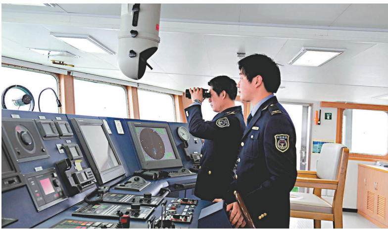
▲16日，中國海監按照有關法律和職責的規定，依法到釣魚島維護我國海洋權益

有關此事，為進一步掌握中方船隻動態情報，日本政府於上午在首相官邸危機管理中心緊急設立了「情報聯絡室」。 日方說，中國海監船一度駛入日本