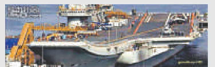
►直8預警直升機、殲15戰鬥機模型已上艦